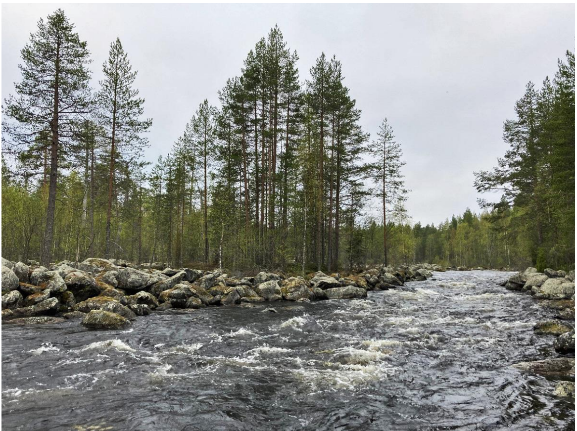
Фото 21. Верхний порог на реке Елма.