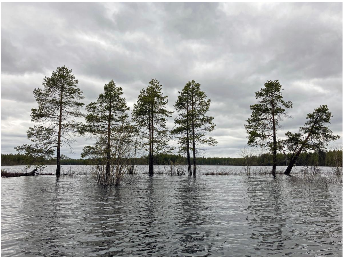
Фото 3. Паводок на Чирка-Кеми.