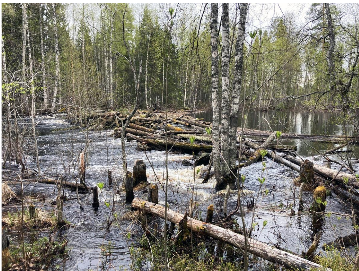
Фото 5. Завал в правой протоке Чирка-Кеми.