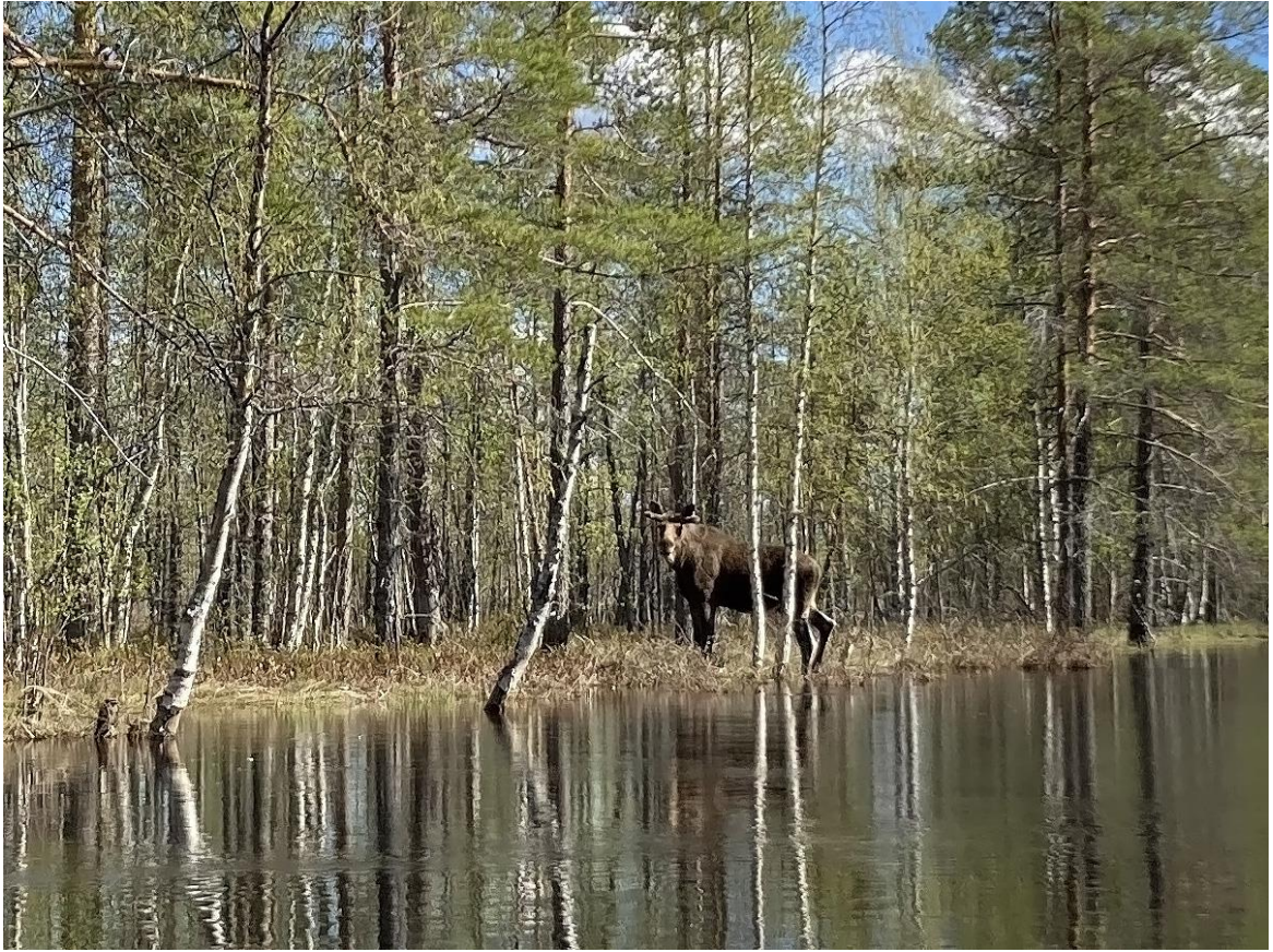
Фото 14. Животный мир Верхней Онды.