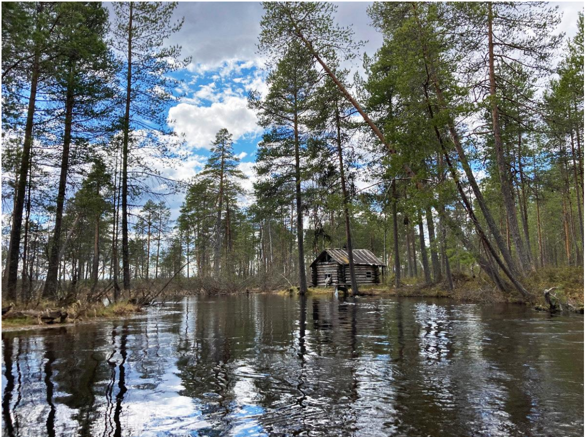
Фото 9. Верховья реки Унга.