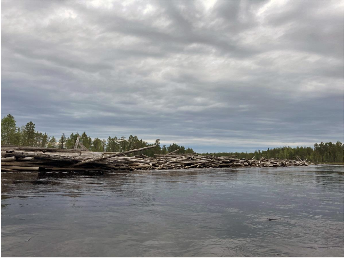
Фото 34. Заломы сплавного леса на Сегеже.