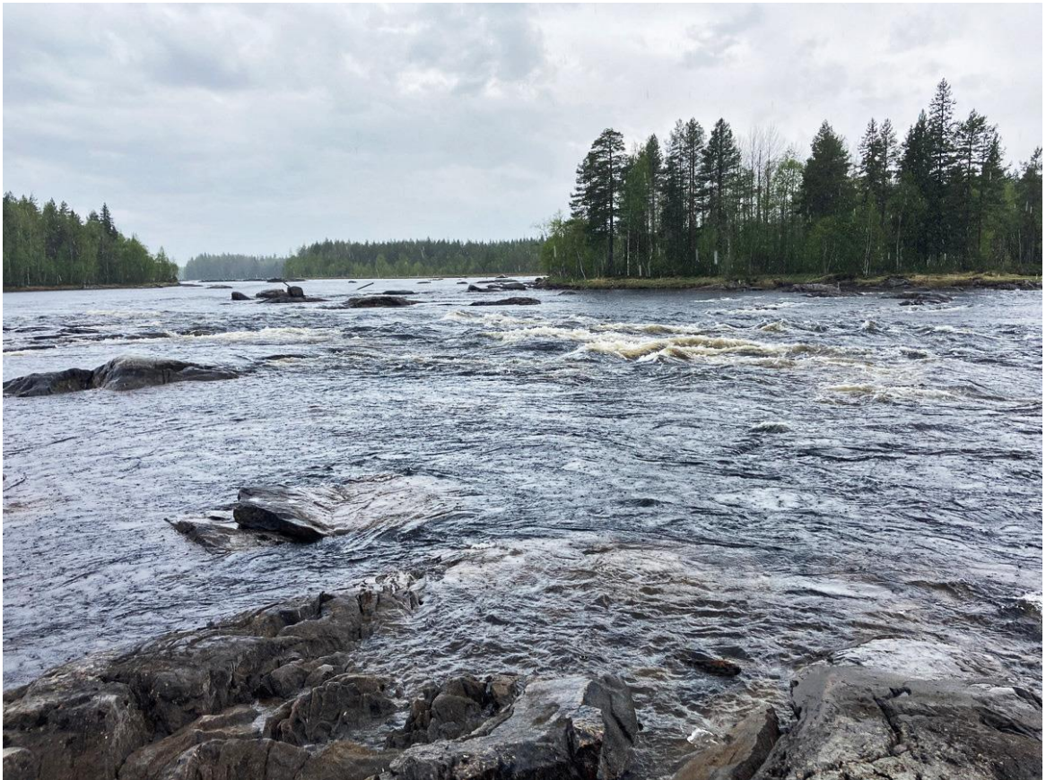
Фото 35. Порог Островной на Сегеже.