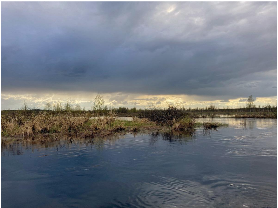
Фото 11. Слияние Унги и Шуовини.