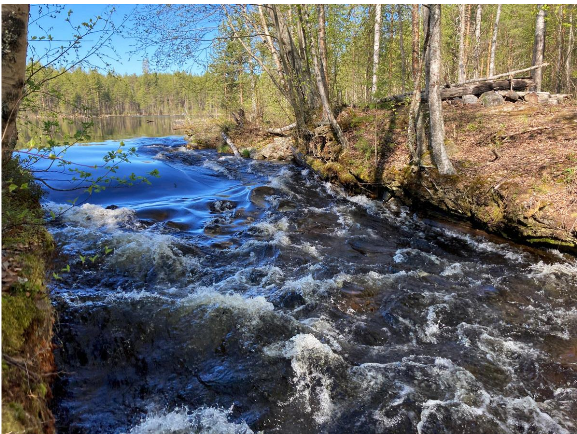
Фото 23. Елма прорывает старую дамбу.