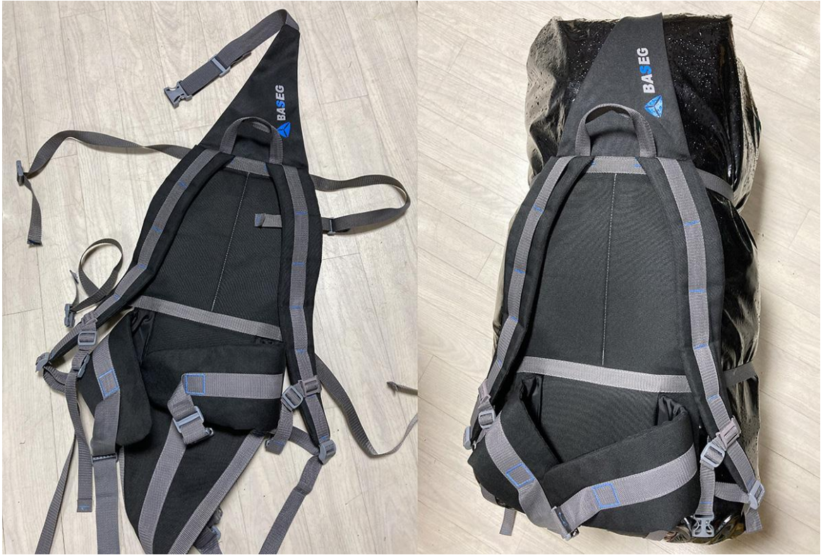
Фото 36. Транспортная система вместо рюкзака.