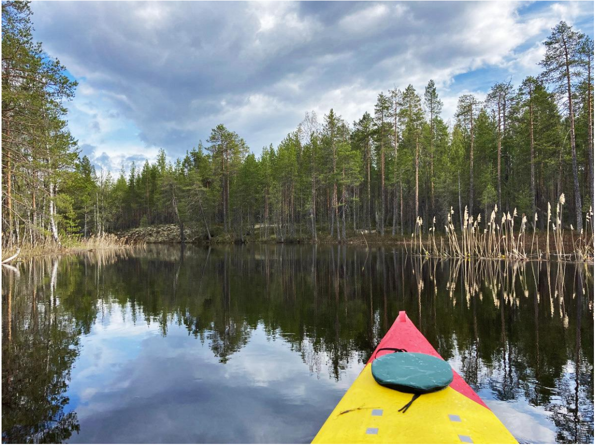
Фото 10. Унга в среднем течении.