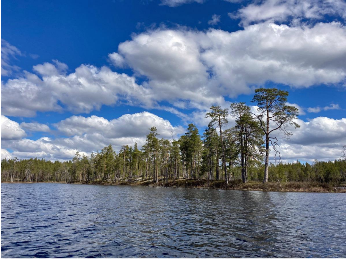
Фото 8. Берега Терваозера.