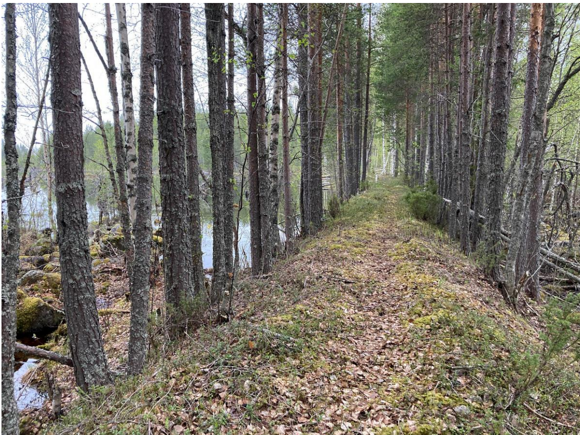
Фото 22. Старая дамба на Елме.