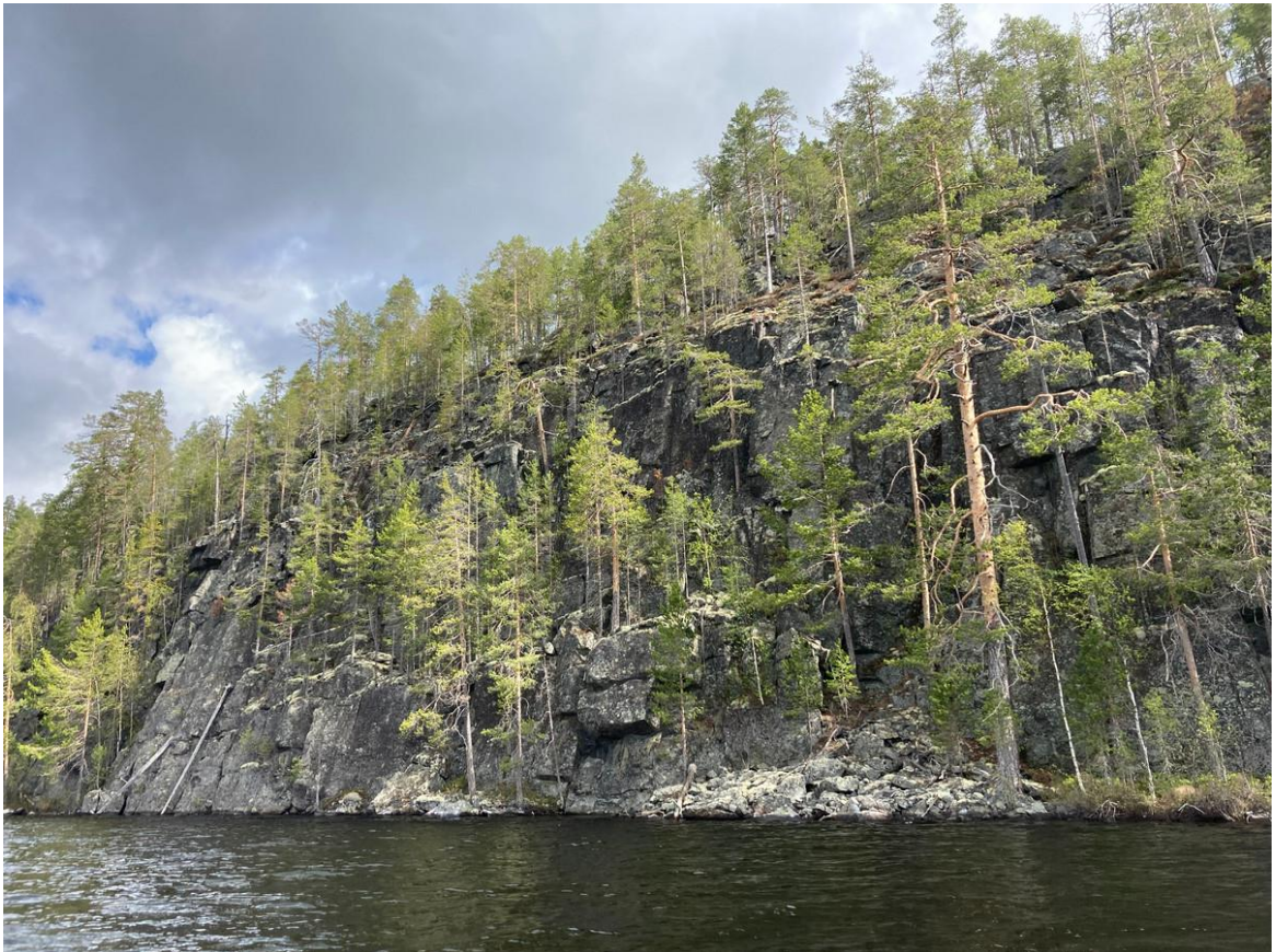
Фото 29. Восточный берег Кальозера.