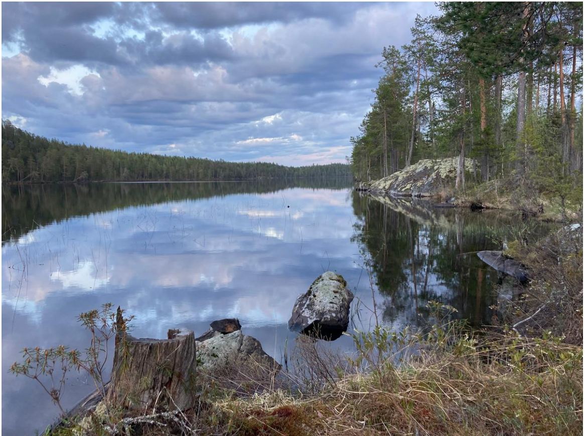
Фото 27. Кальозеро.