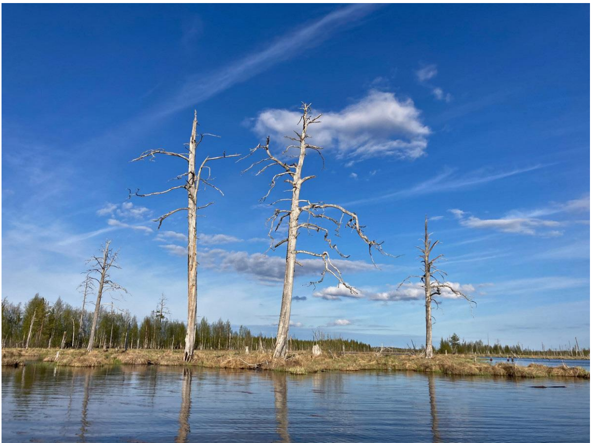
Фото 15. Болотистые берега Верхней Онды.