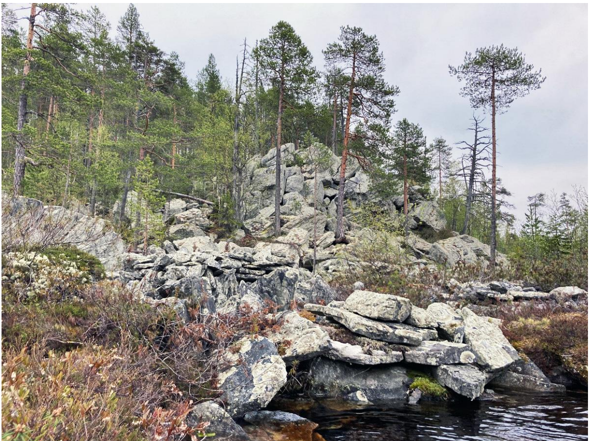
Фото 19. Скалы в верховьях реки Елма.