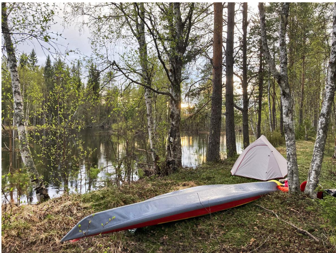
Фото 12. Стоянка на Верхней Онде.