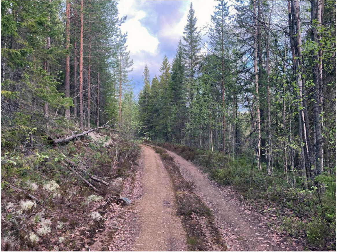
Фото 26. Дорога на волоке к Кальозеру.