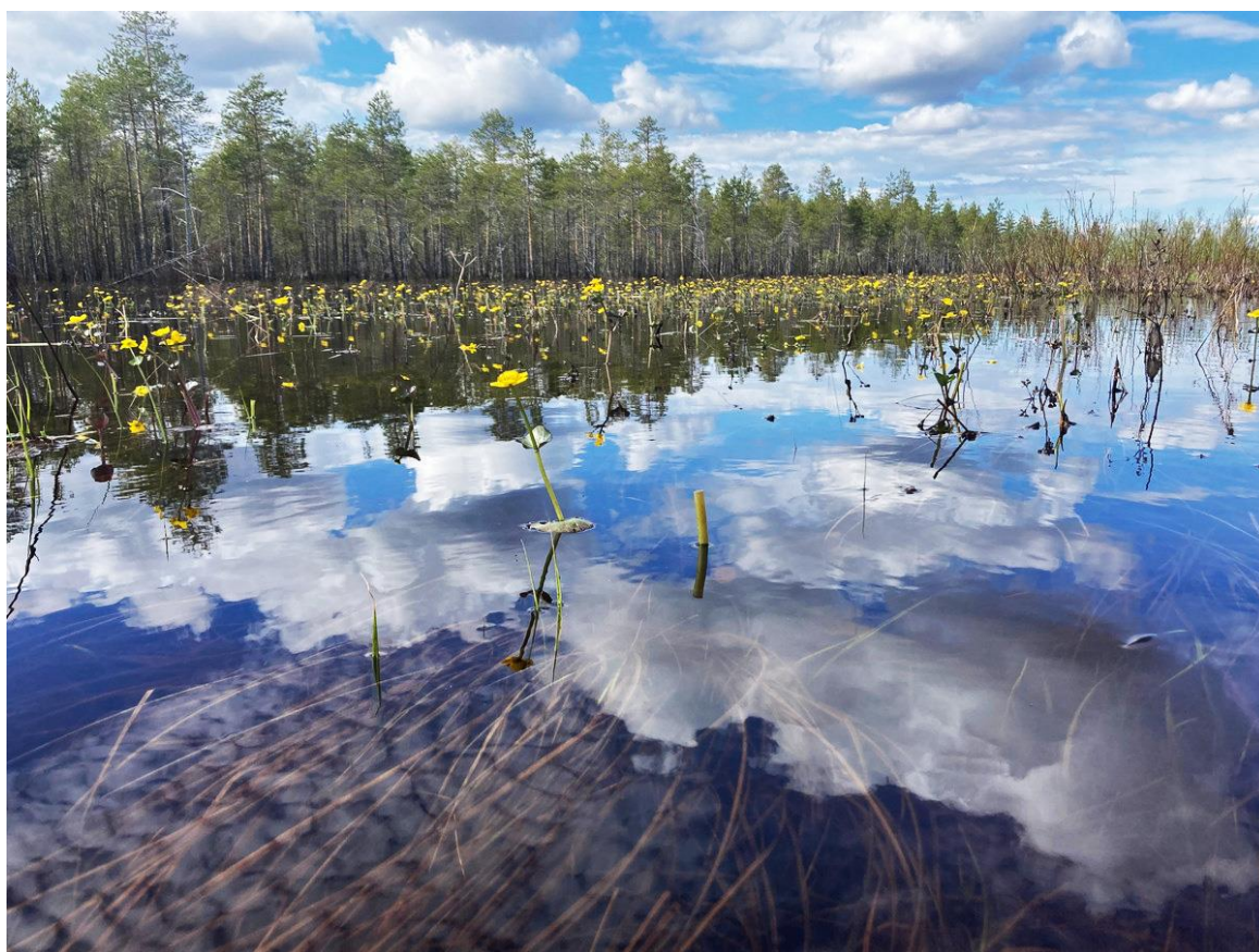
Фото 13. Болотистые берега Верхней Онды.