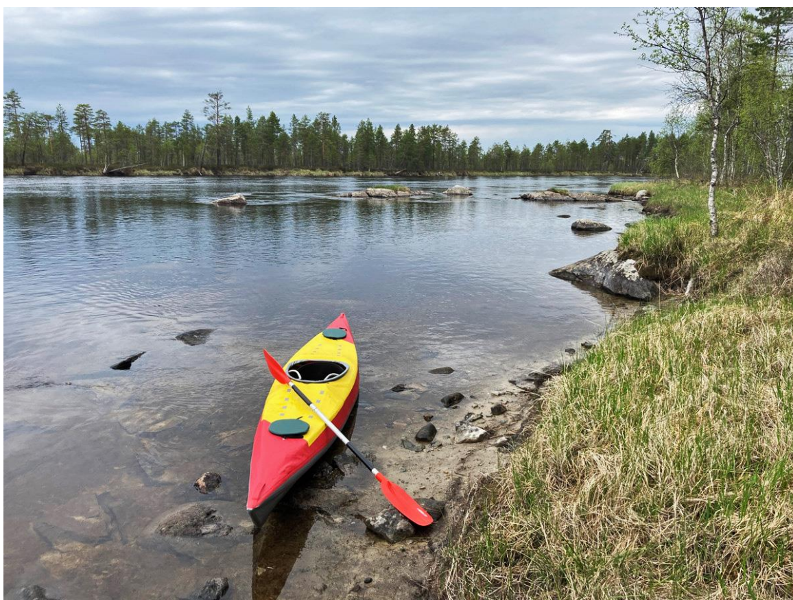
Фото 33. Сегежа перед впадением Вайвонца.