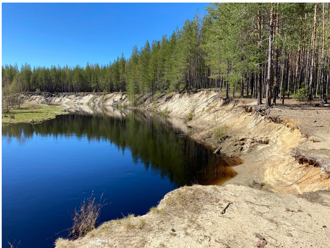
Фото 1. Река Муезерка.

После нижней порожистой секции дальнейший путь – гребля по ровной воде до города Сегежа. Теоретически, можно выбраться с реки раньше, в деревне Табой-порог или с моста Мурманского шоссе. На Линдозере много островов, есть пляжи и стоянки.