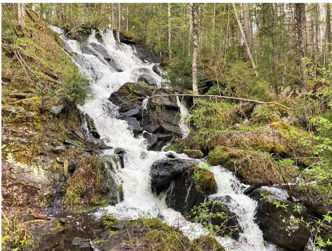
Фото 25. Шалговаарский водопад.