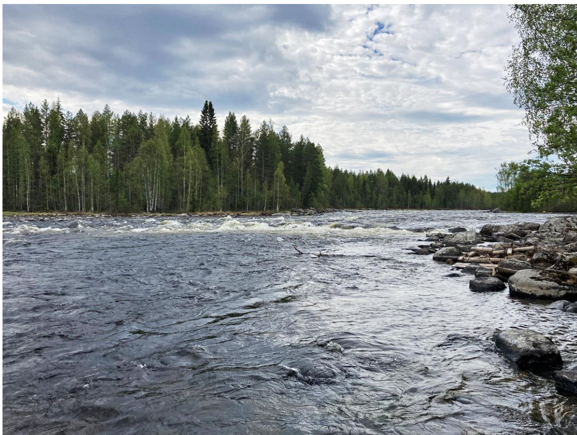
Фото 32. Попов порог на Сегеже.