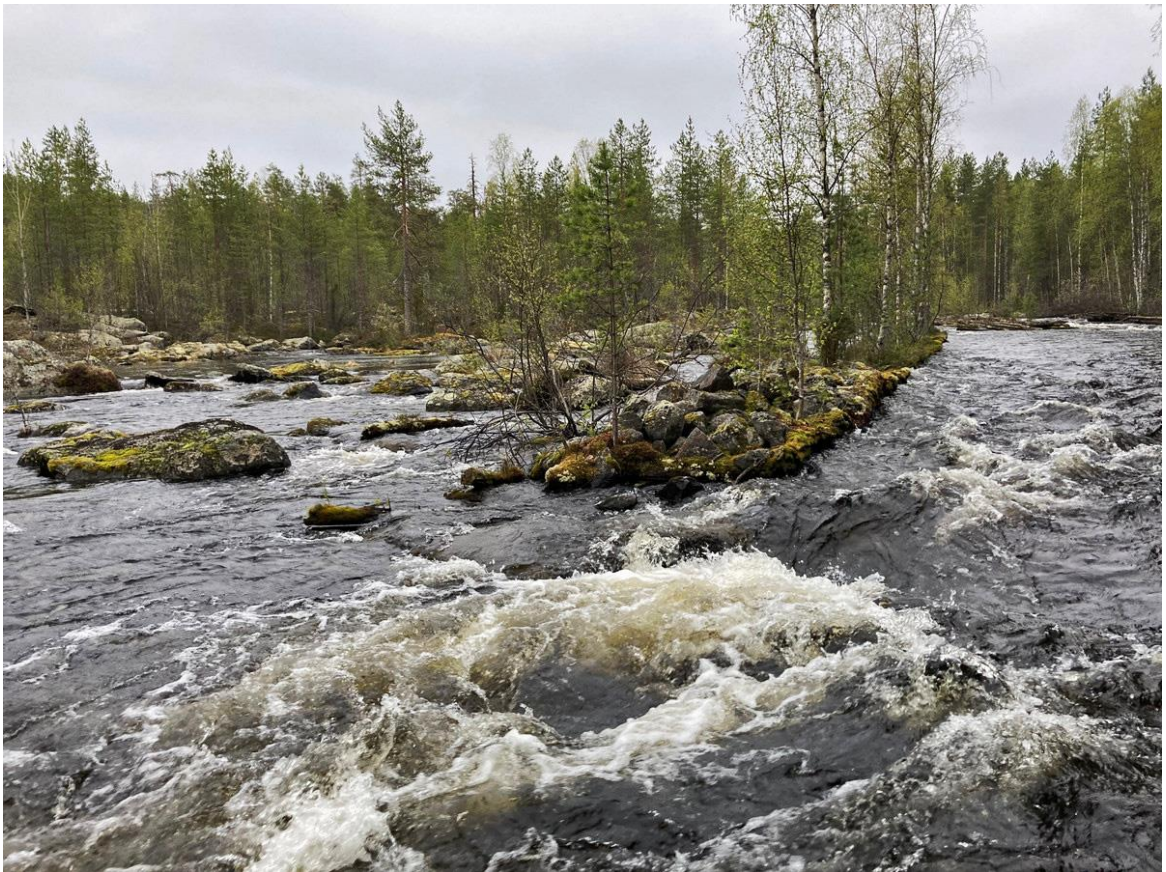
Фото 20. Верхний порог на Елме.