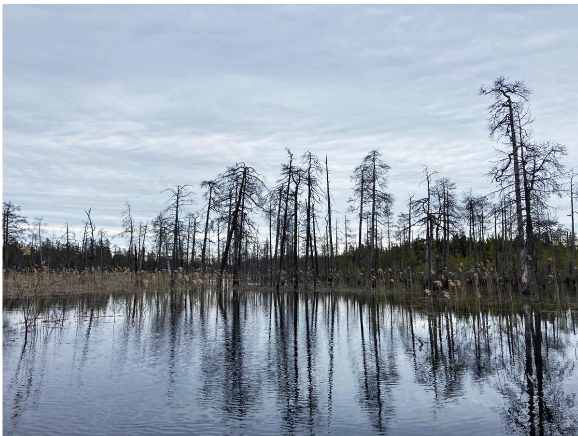
Фото 6. Ручей Эльми (Папин).