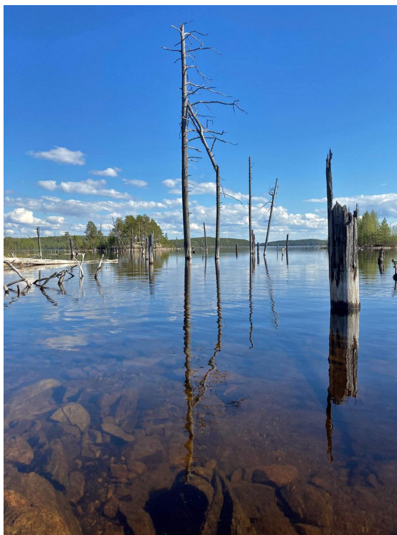
Фото 31. Сегозеро.