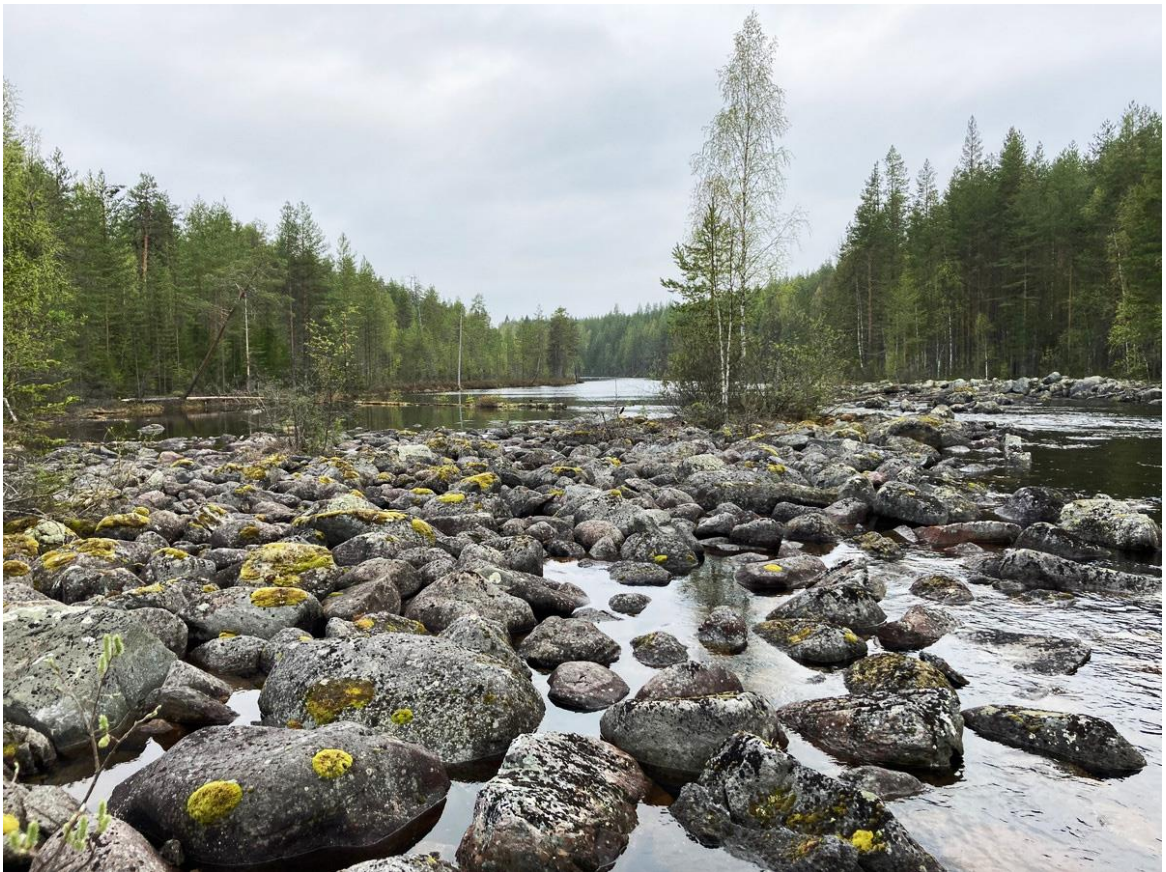
Фото 18. Верховья Елмы.