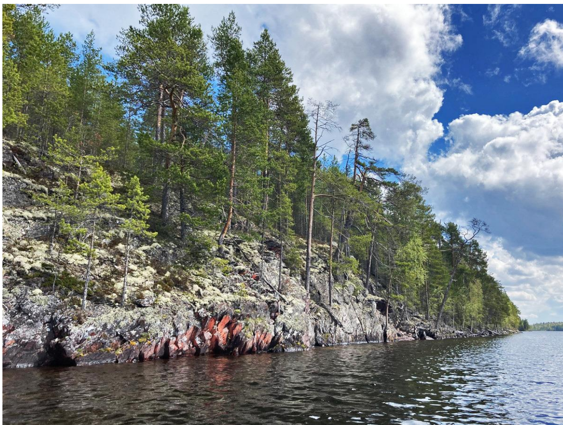
Фото 24. Берега Елмозера.