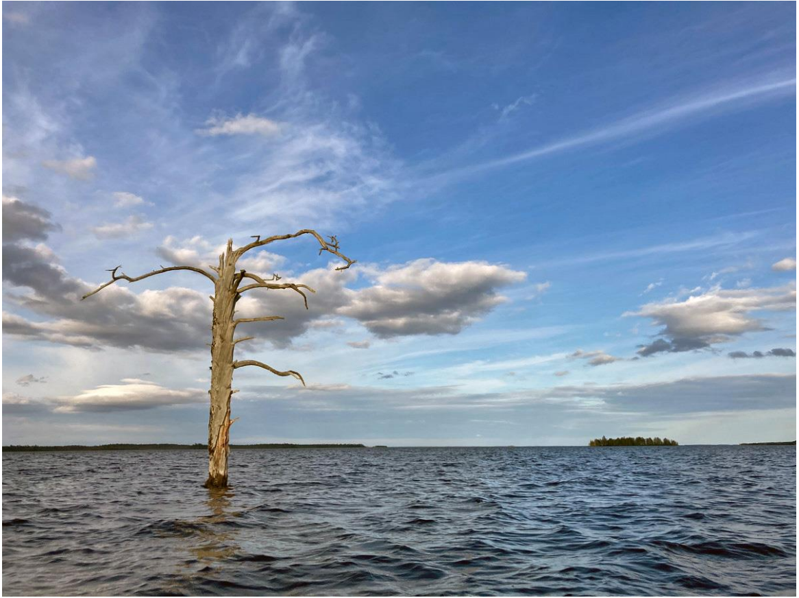
Фото 16. Ондозеро.