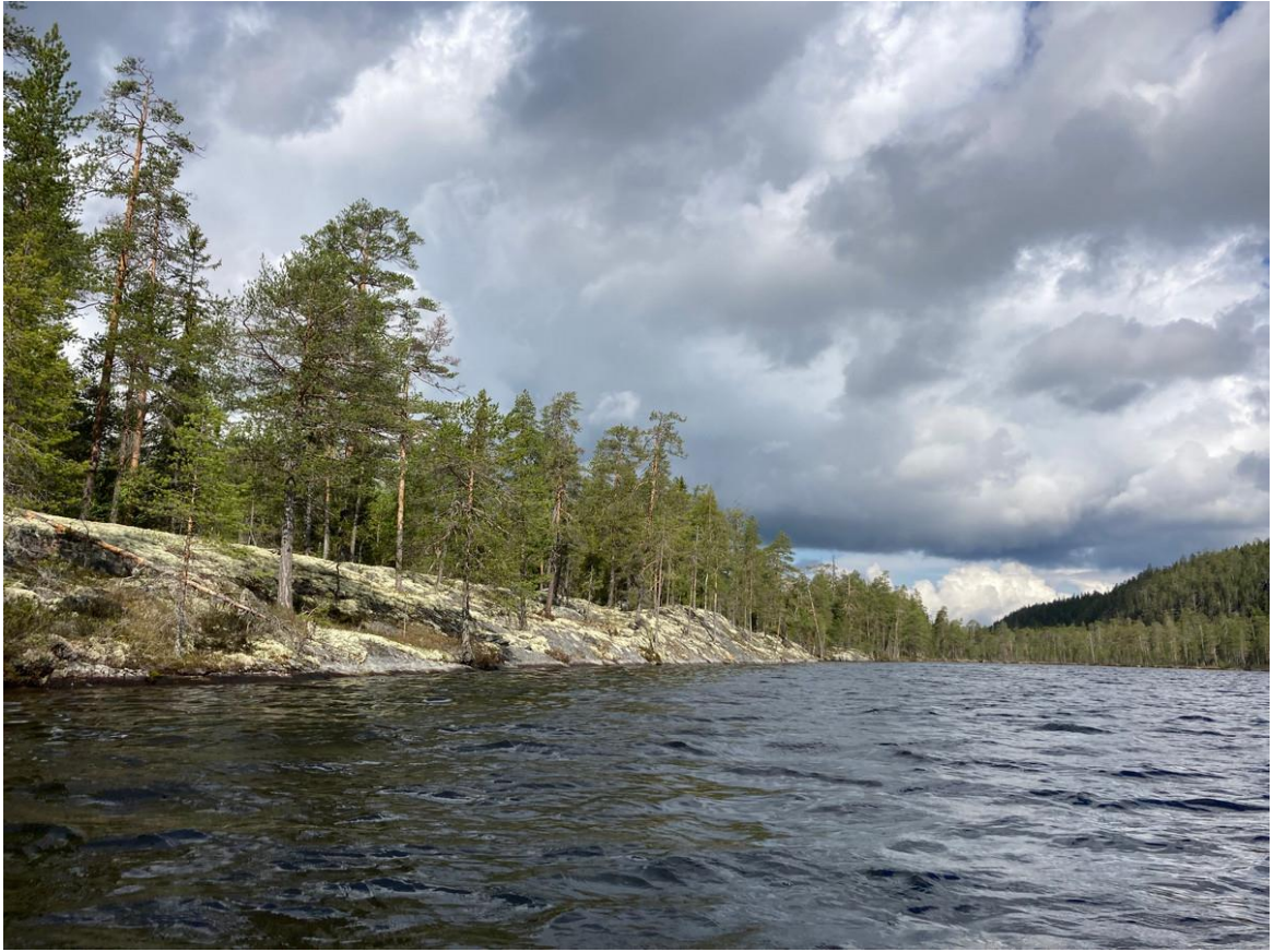
Фото 28. Западный берег Кальозера.