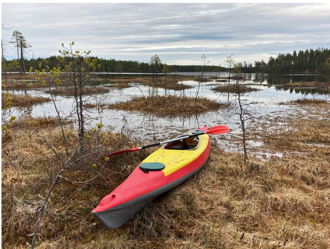
Фото 7. Окончание волока на озеро Валгилампи.