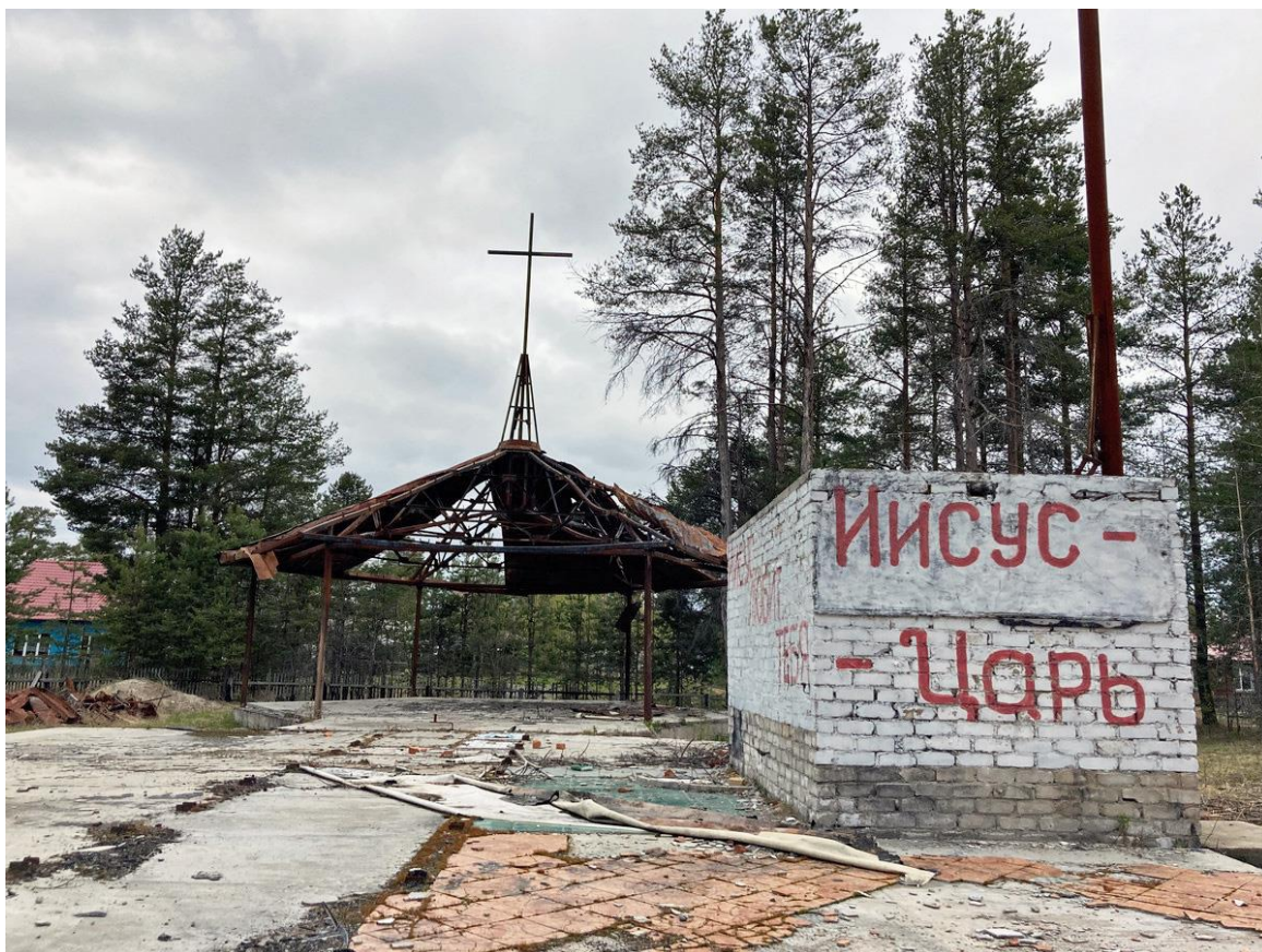
Фото 4. Деревня Тикша, настроение.