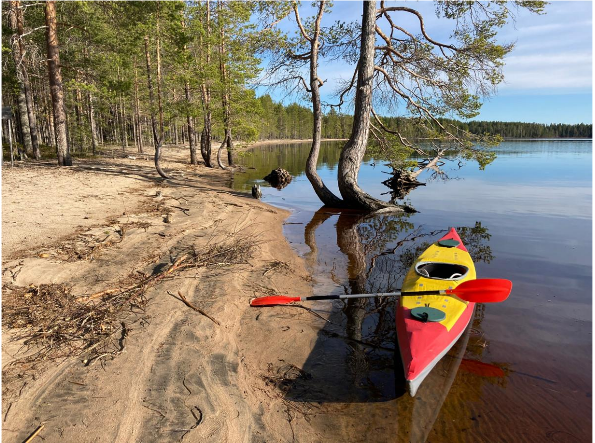
Фото 2. Озеро Момсярви.