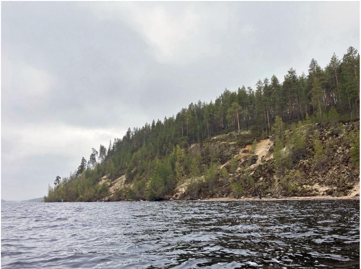
Фото 17. Берега Ондозера, гора Халговара.