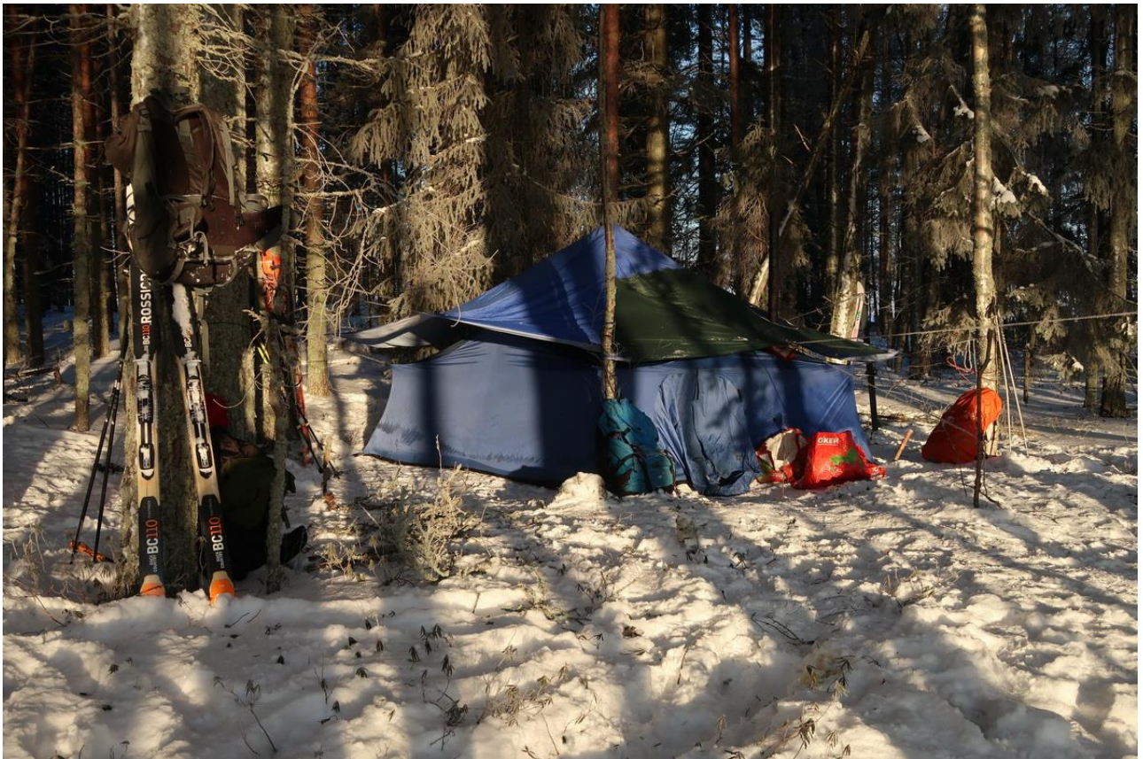
Фото 36. Морозное утро последнего походного дня.