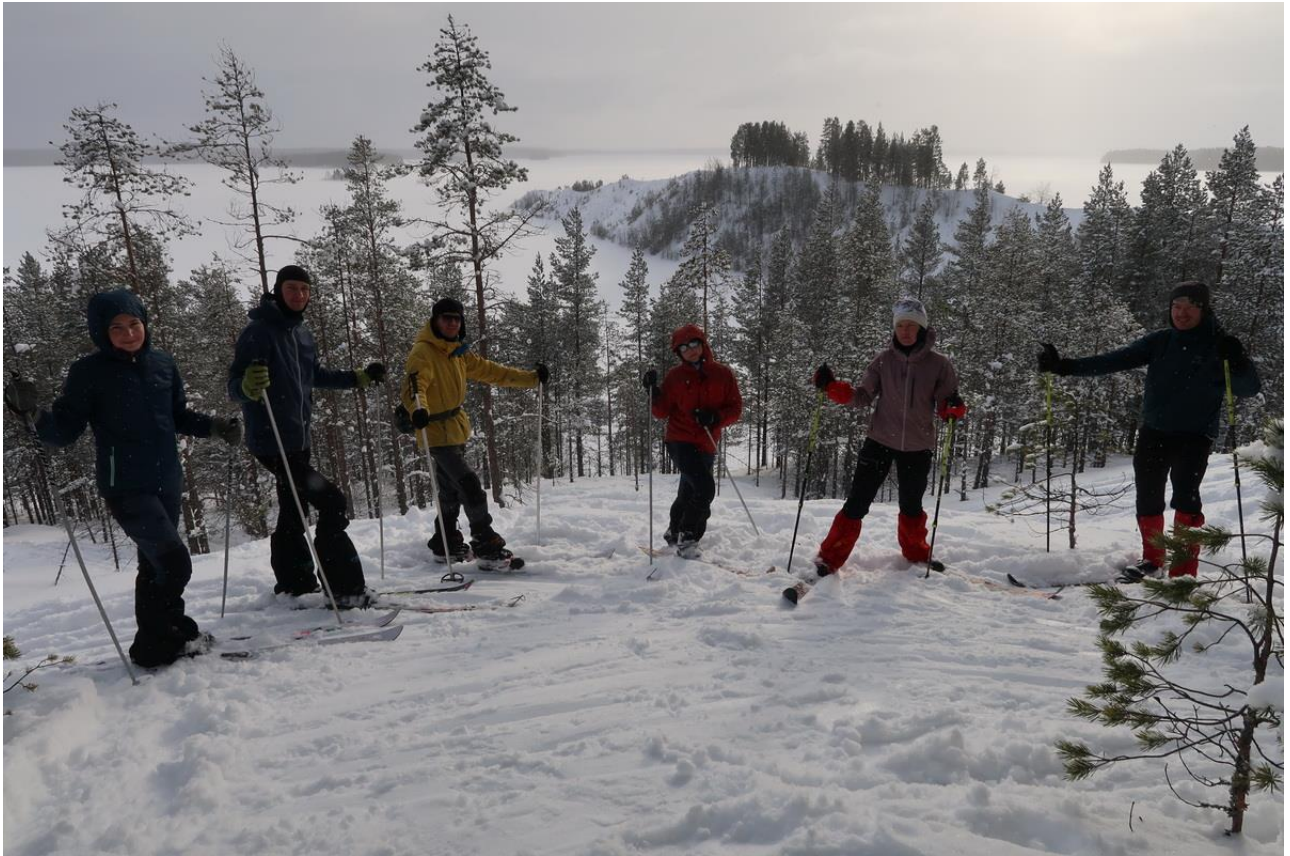
Фото 33. Над Выгозером на безымянной высоте: вид на Веррогубу.