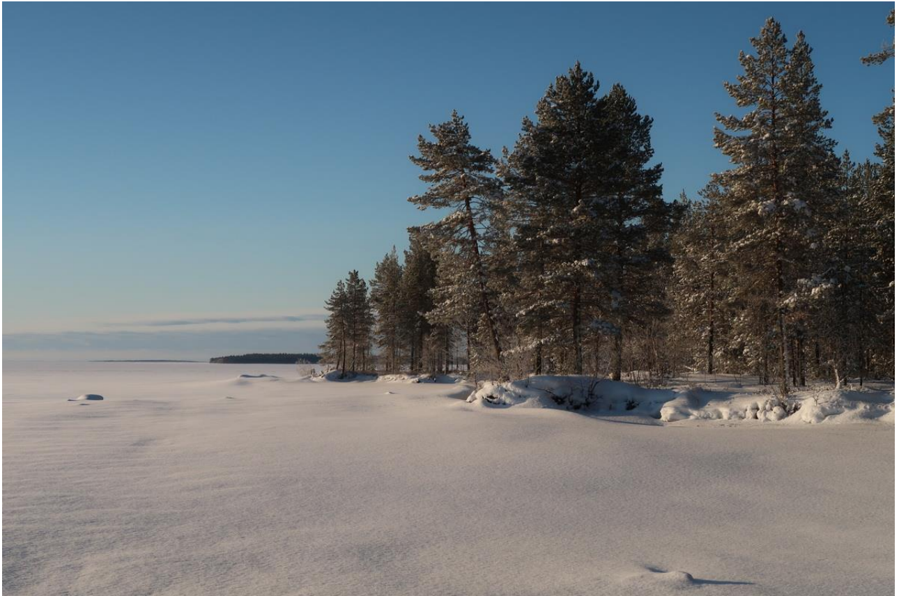
Фото 37. Мыс Перзин Наволок и урочище Семиверстная Корга на Выгозере.