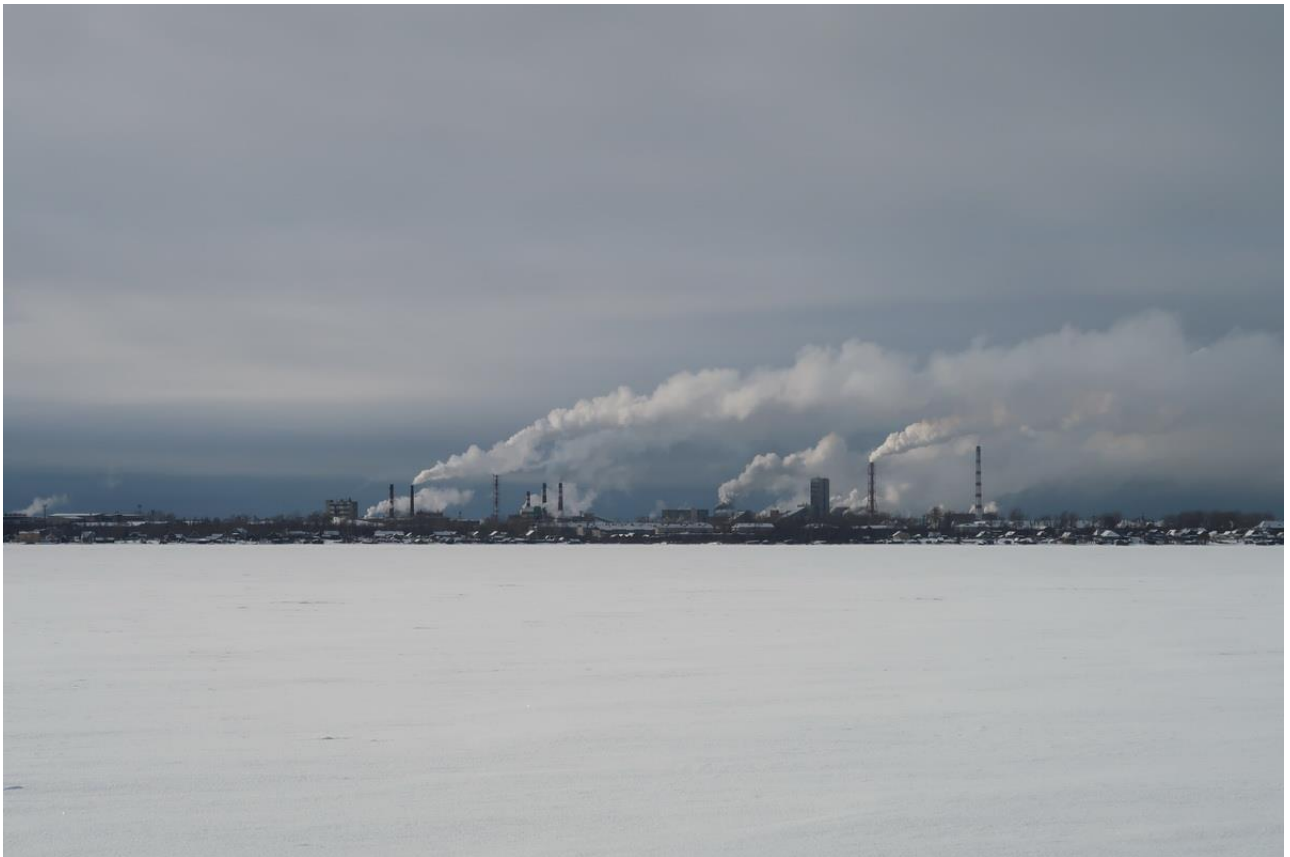
Фото 40. Сегежа.