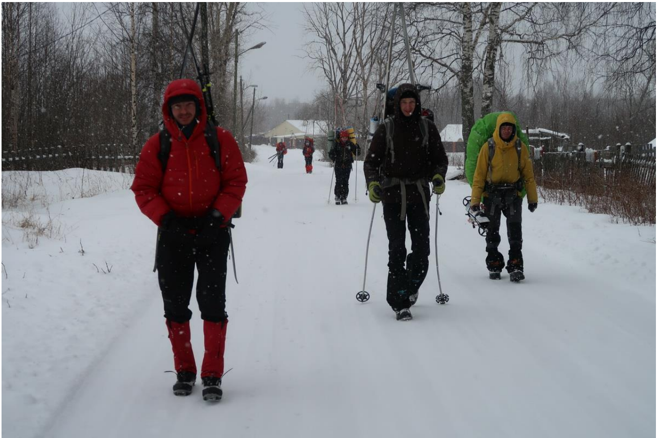
Фото 42. По Сегеже к вокзалу.