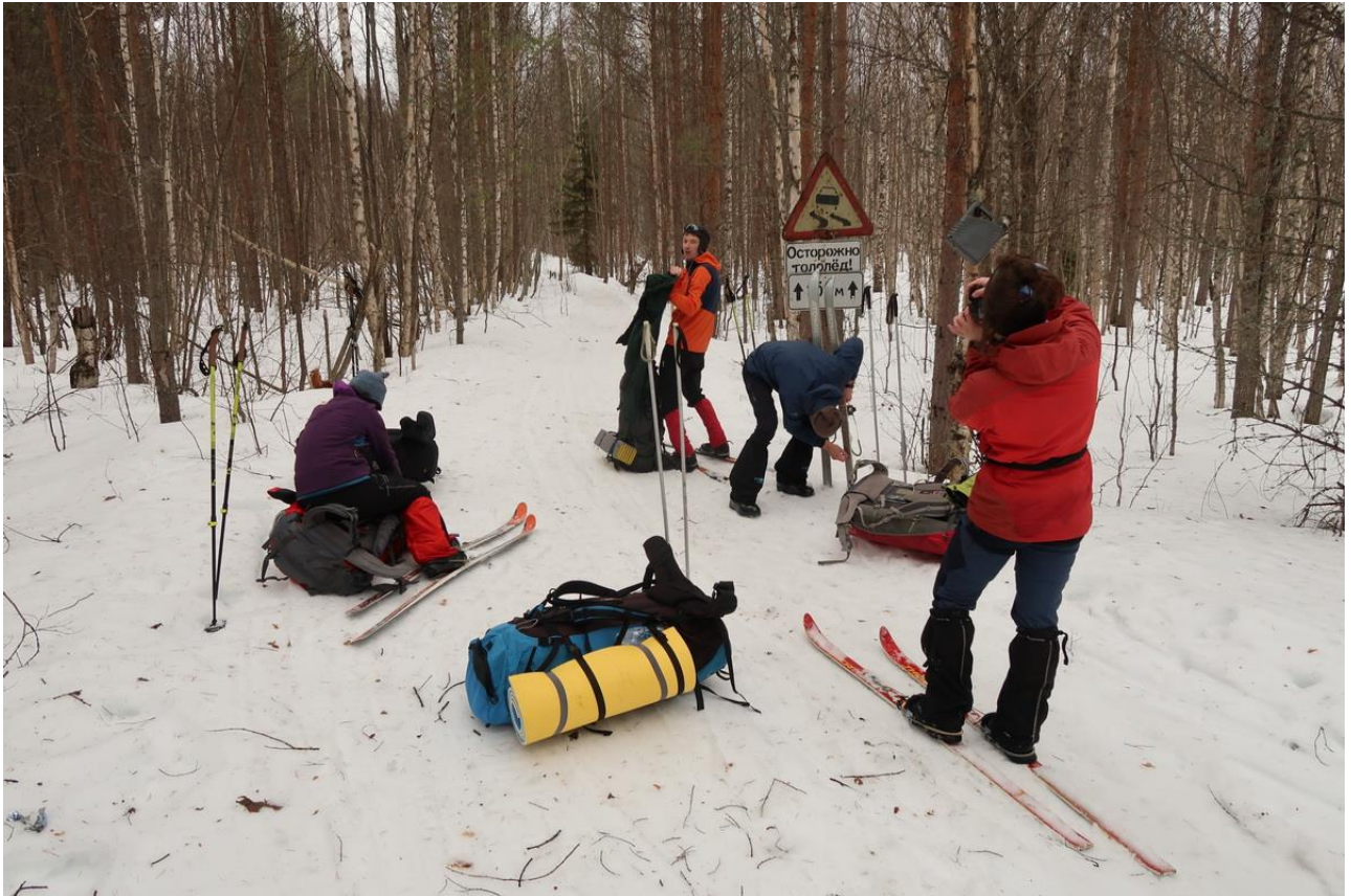
Фото 3. Снегоходный путь от заброшенной деревни Восточная Идель.