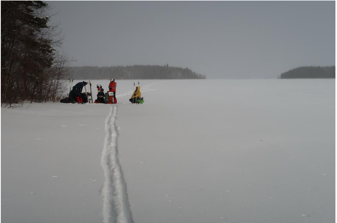
Фото 35. Движение по Выгозеру.