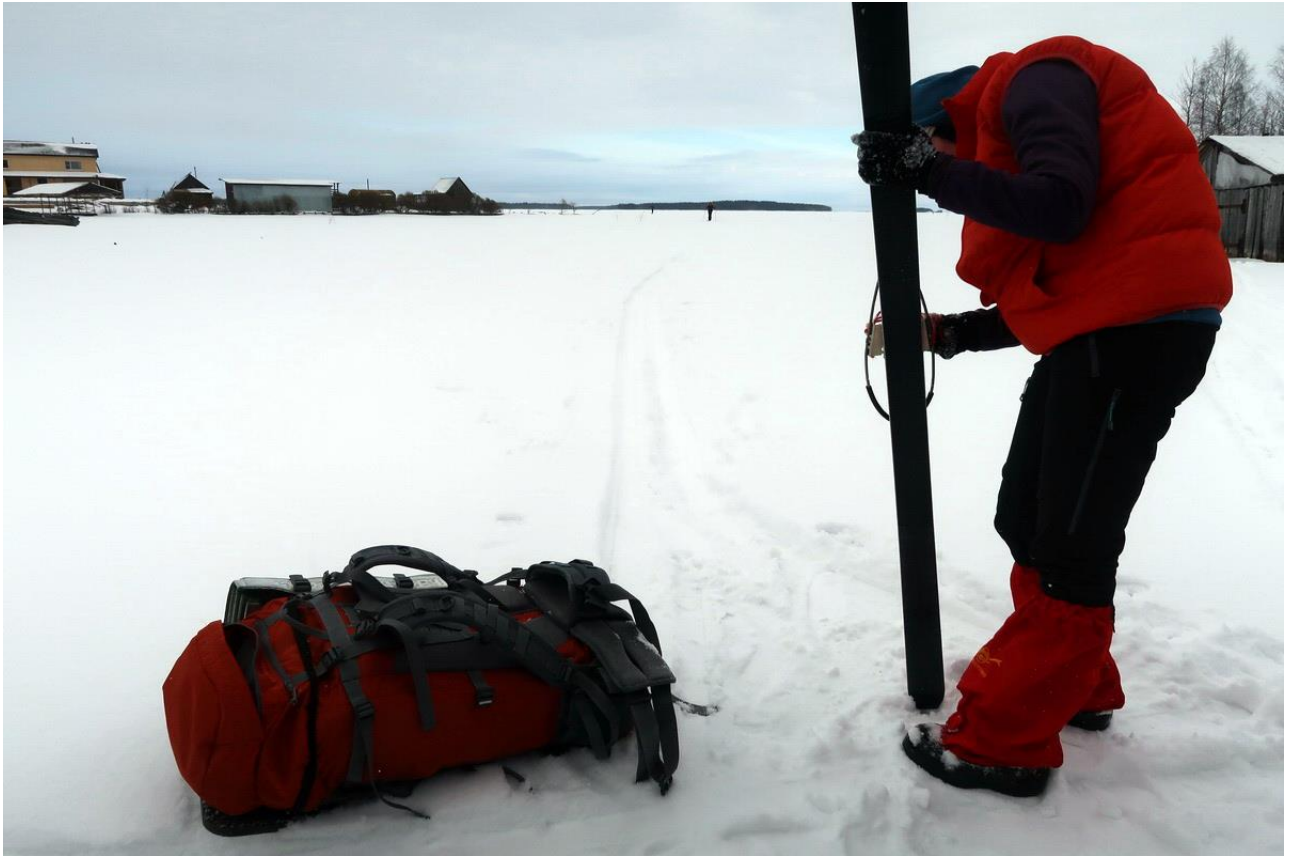
Фото 41. Выходим со льда Выгозера на окраину города Сегежа.