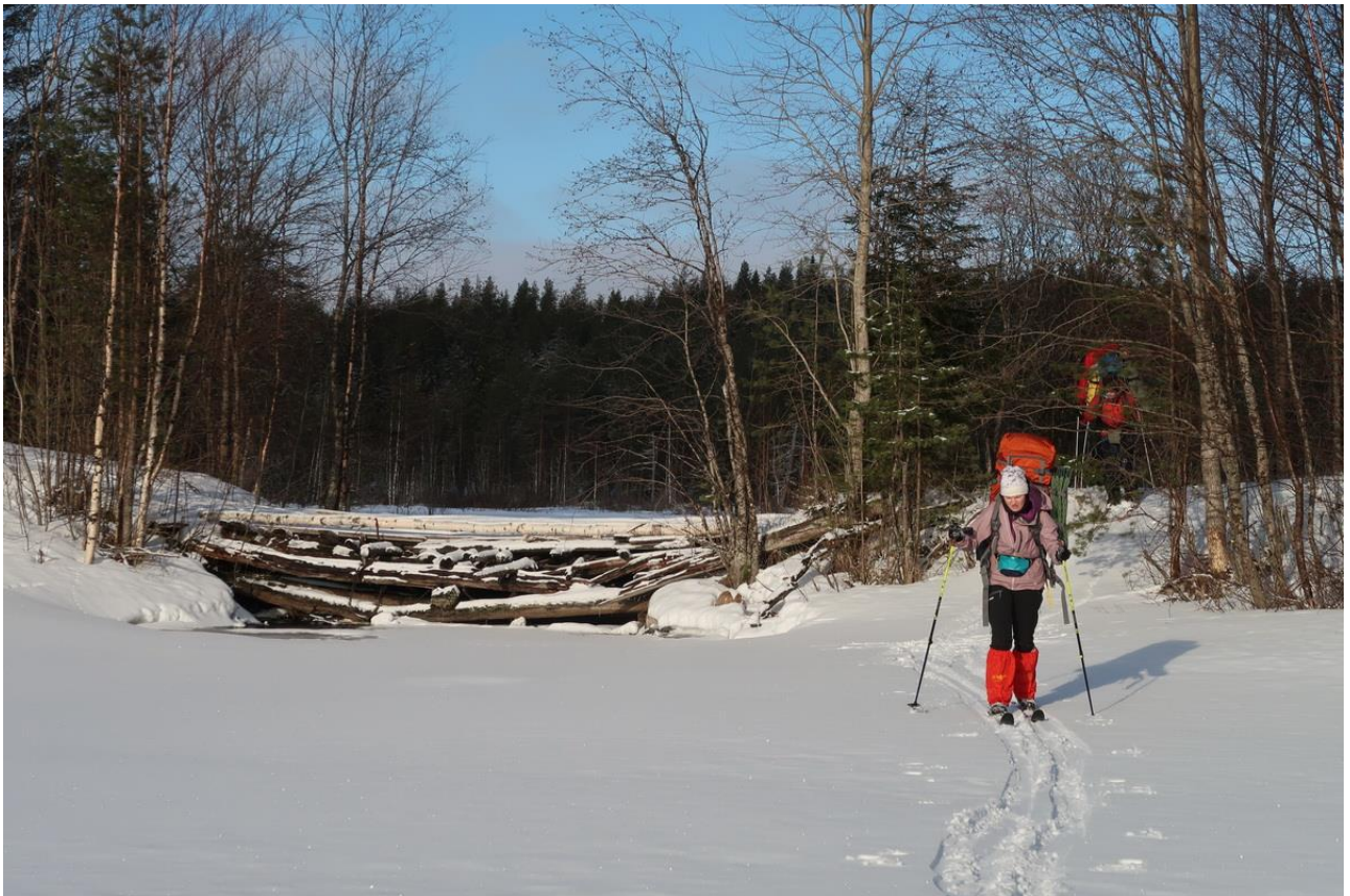
Фото 12. Мост на притоке р.Сума.