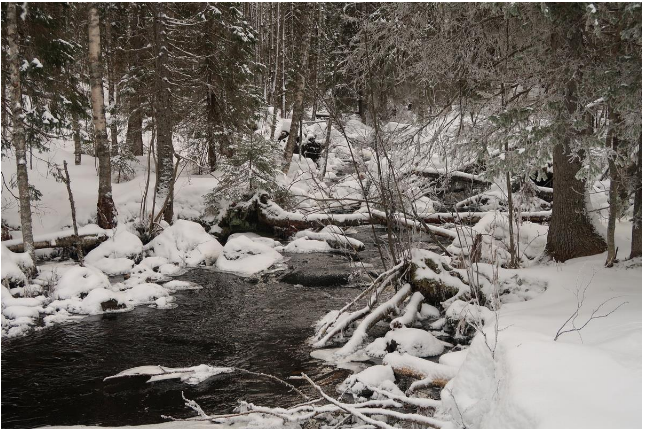
Фото 26. Незамерзающий Лишеручей.