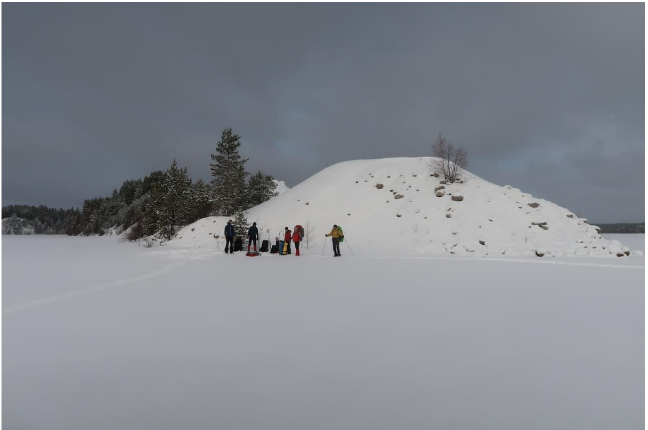
Фото 32. Мыс на Выгозере напротив острова Верро-Пески.