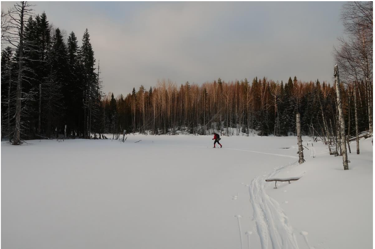
Фото 16. Замерзшие плесы на реке Боевушка.