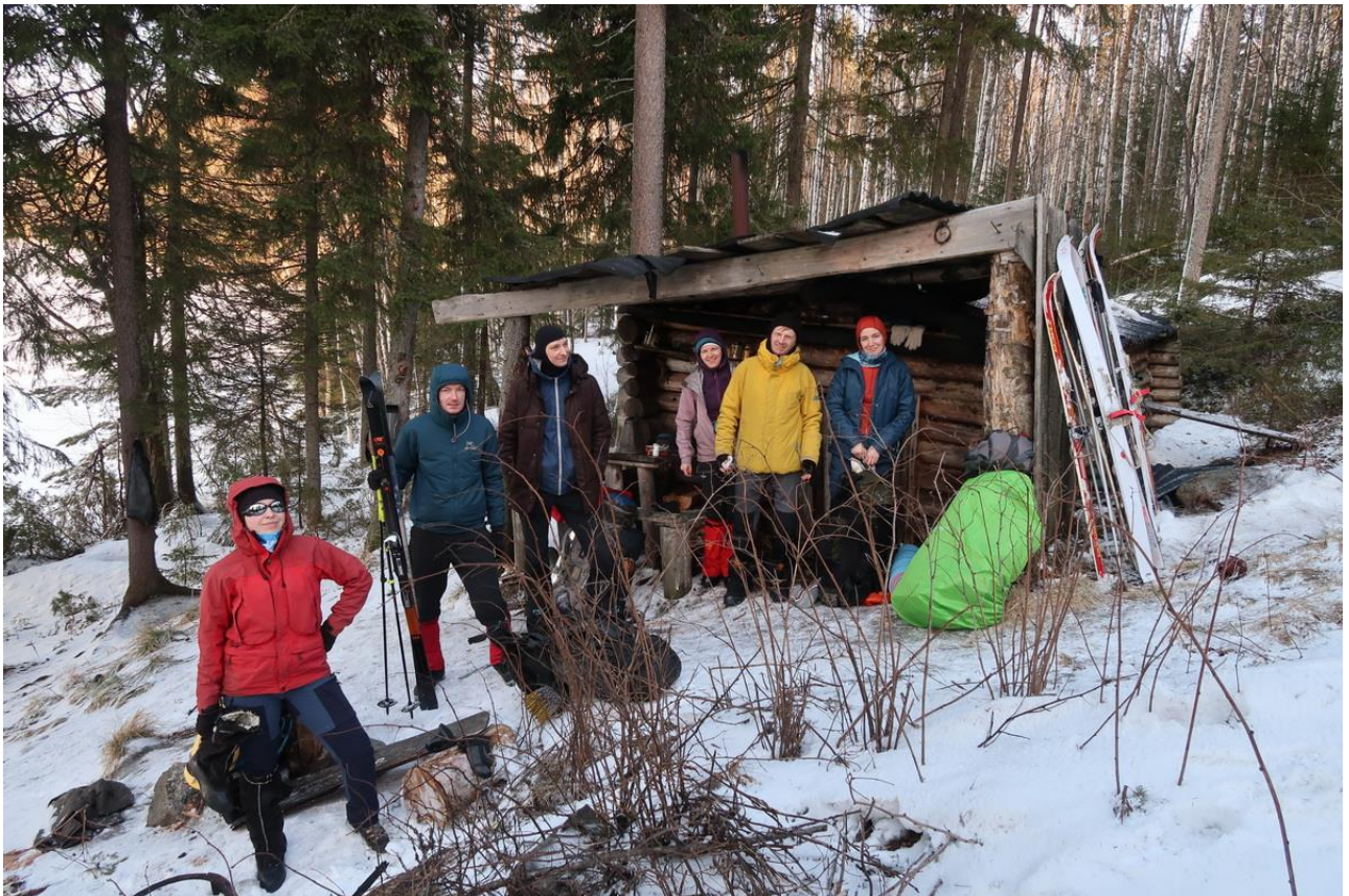
Фото 4. Группа возле избы на оз.Воеполь.