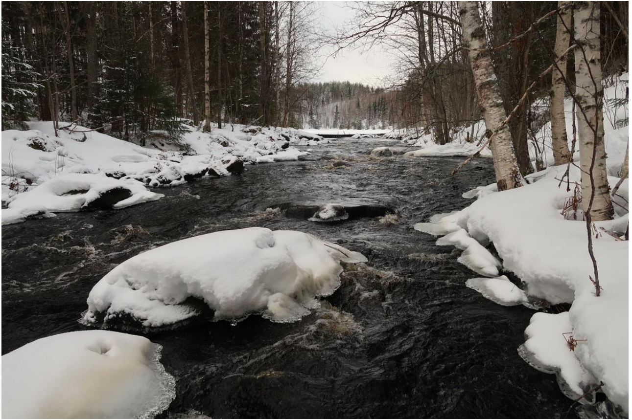
Фото 13. Незамерзающие участки на реке Боевушка требуют обходов по берегу.