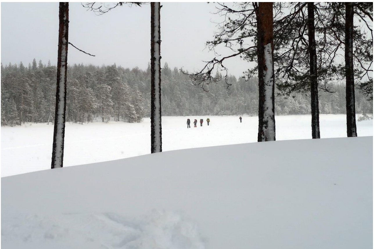
Фото 30. Движение по озерам.