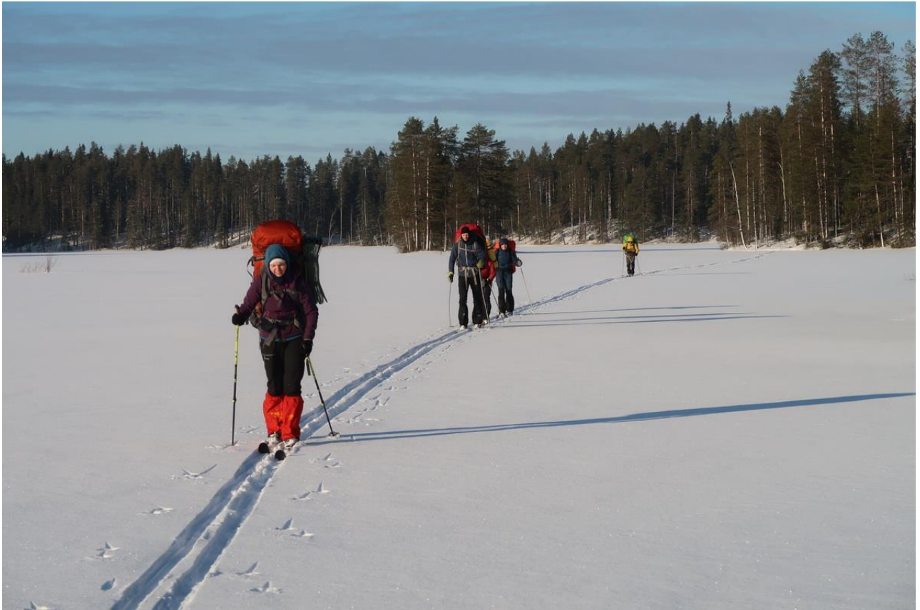
Фото 21. Группа на озере Метчозеро.