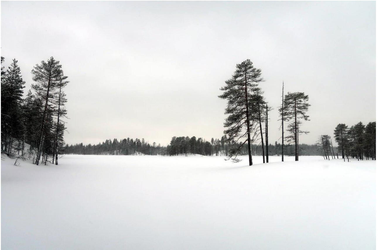
Фото 29. Каноничный карельский пейзаж озера Красная Ламбина.