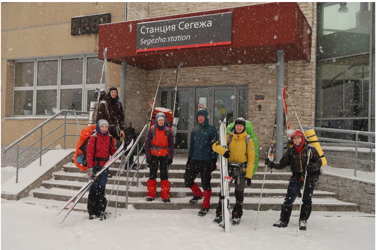
Фото 44. Группа на финише маршрута