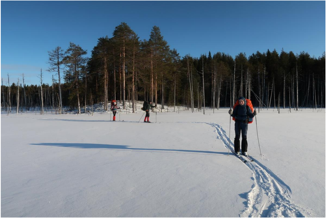
Фото 11. Движение к р.Сума по открытым болотам с плотным настом.