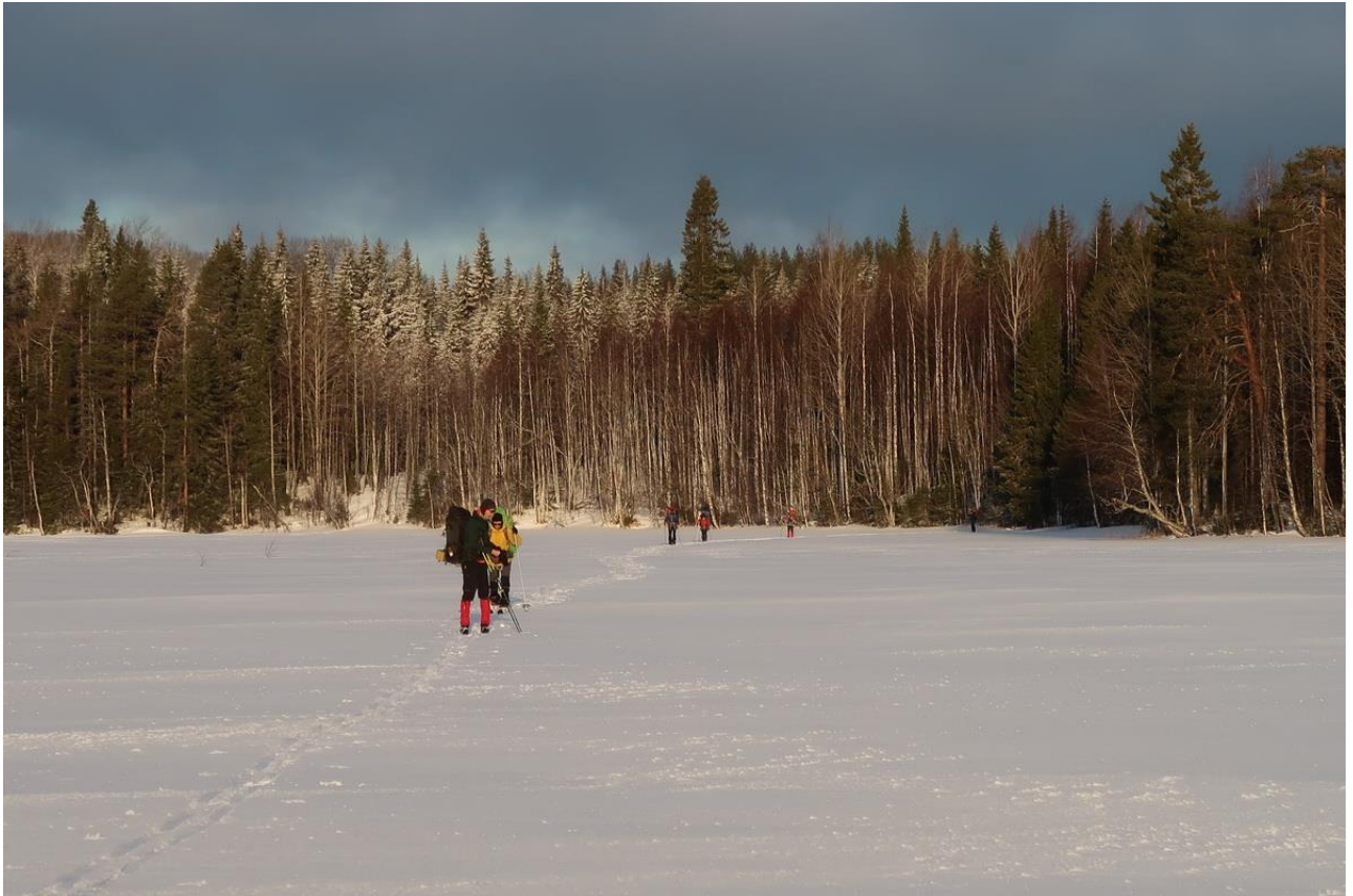
Фото 5. Группа на льду озера Воеполь.