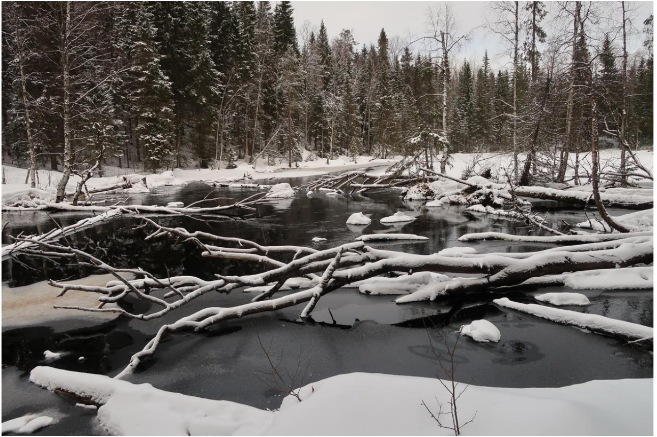
Фото 15. Река Боевушка.