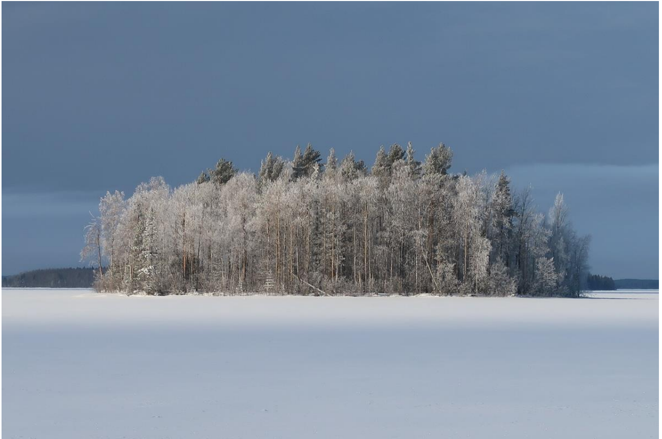
Фото 39. Заиндевевшие острова на Выгозере в районе Беломоро-Балтийского канала.