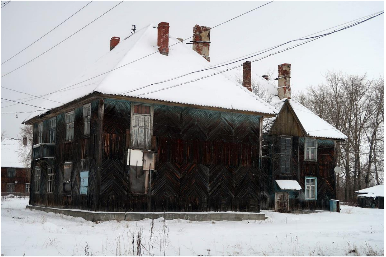
Фото 43. Старые дома строителей Беломорканала.