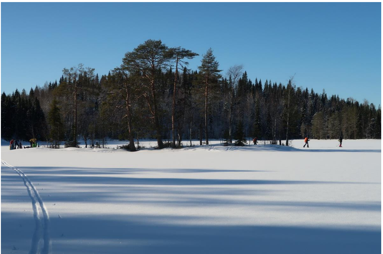
Фото 18. На озере Курганец.