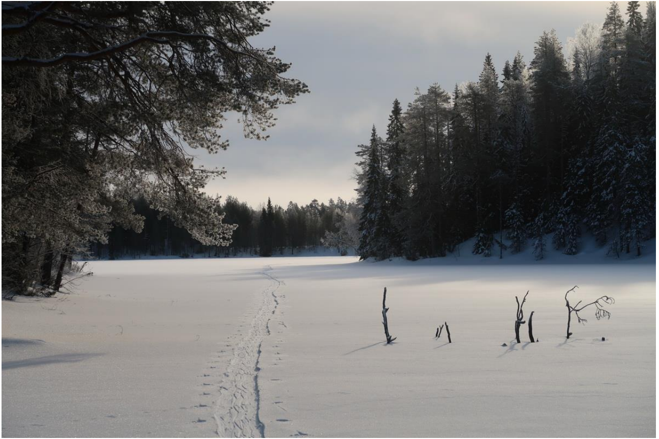
Фото 23. Озеро Островное.