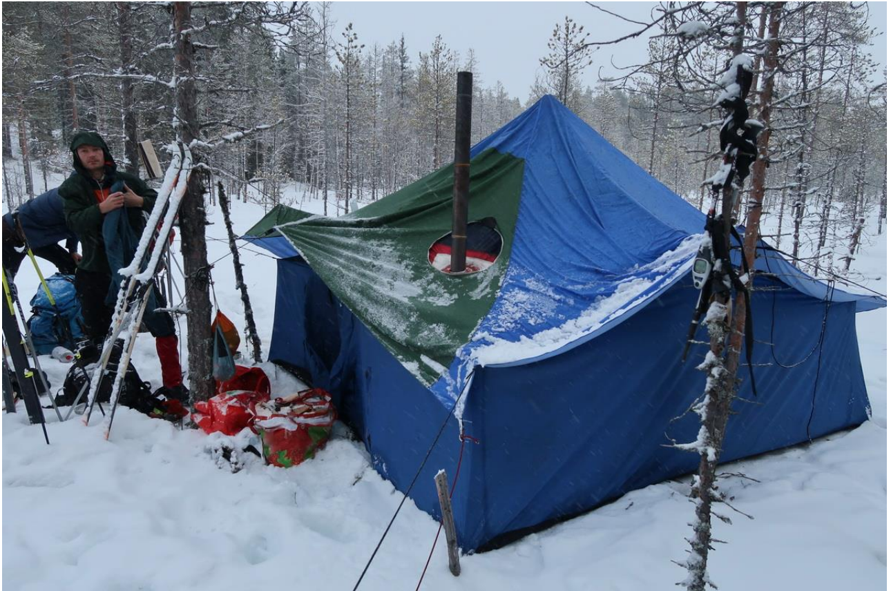
Фото 7. Лагерь возле р.Лебяжья, 3-я ночевка на маршруте.