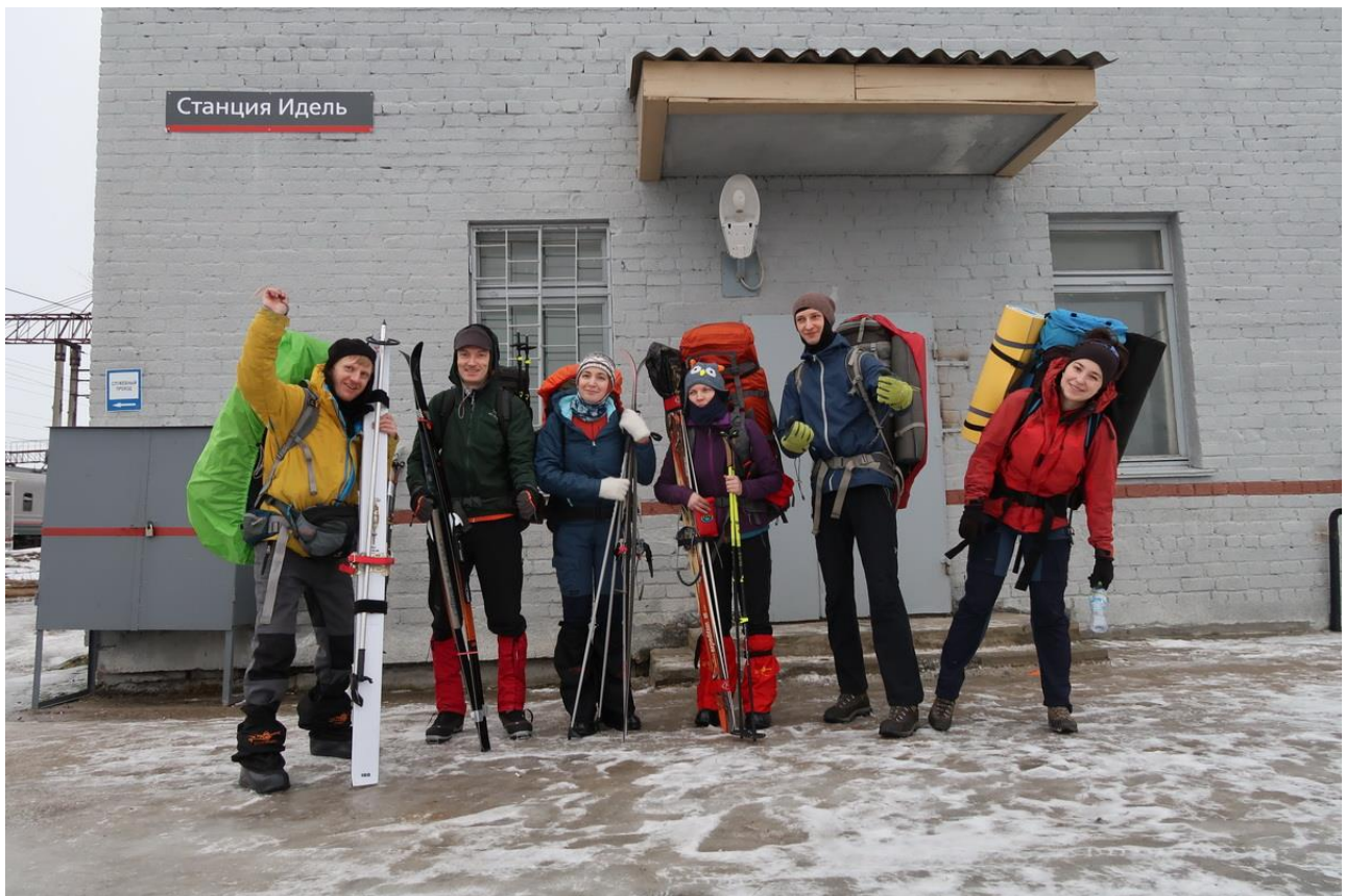
Фото 1. Группа на старте маршрута.