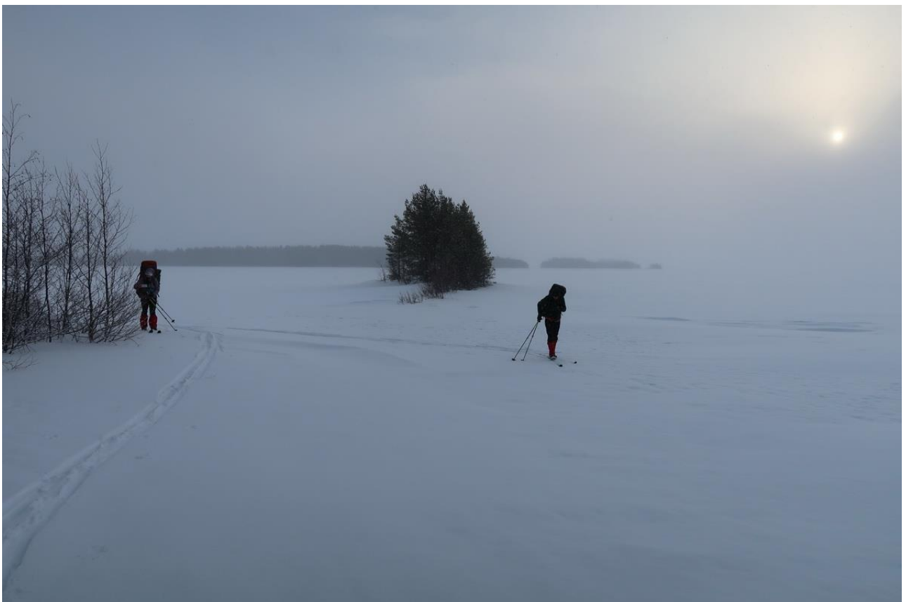
Фото 8. На льду Сумозера.