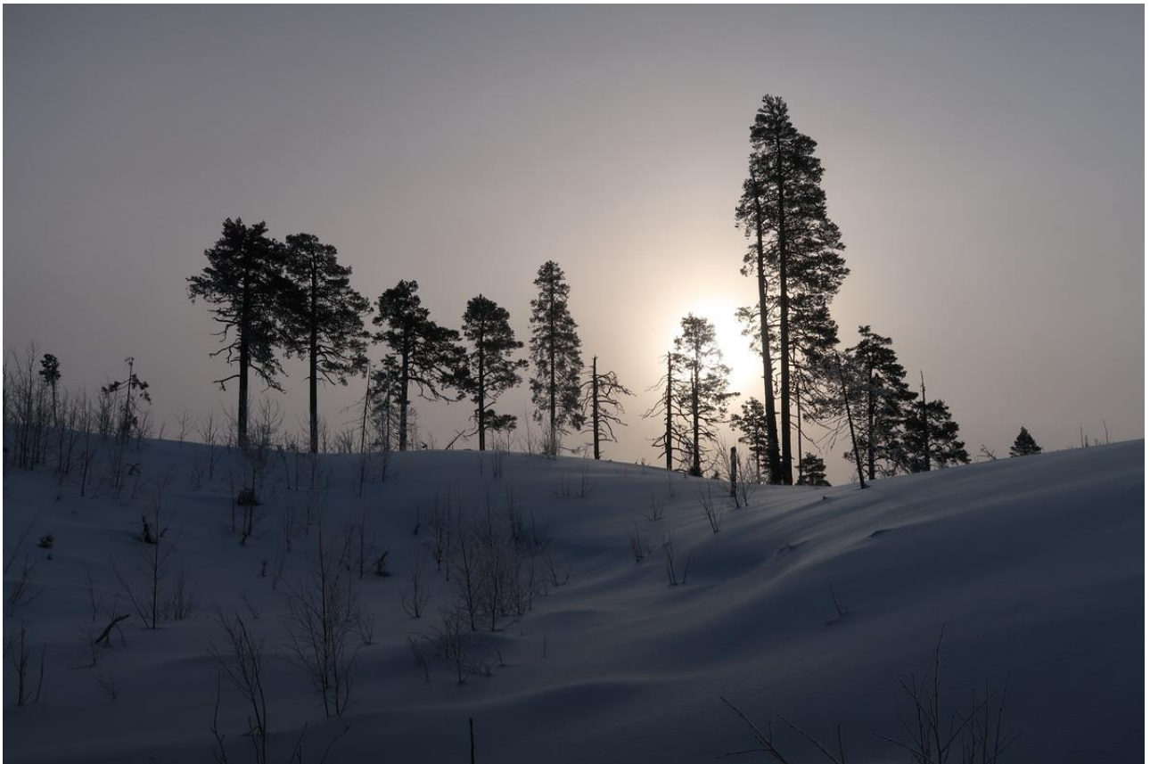
Фото 24. Старые вырубki в районе озера Островное.