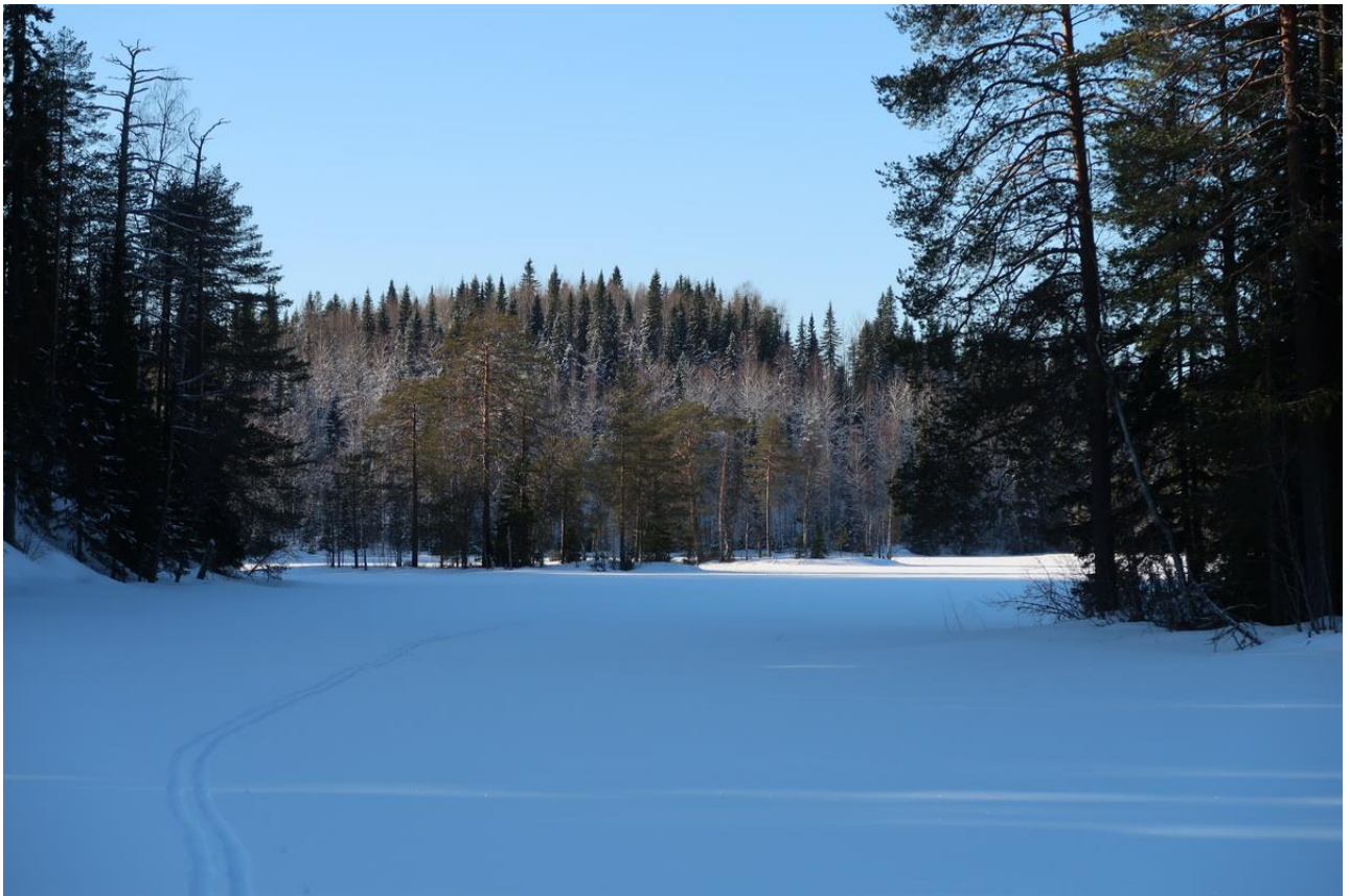
Фото 20. Курганец – одно из наиболее живописных озер нашего маршрута.