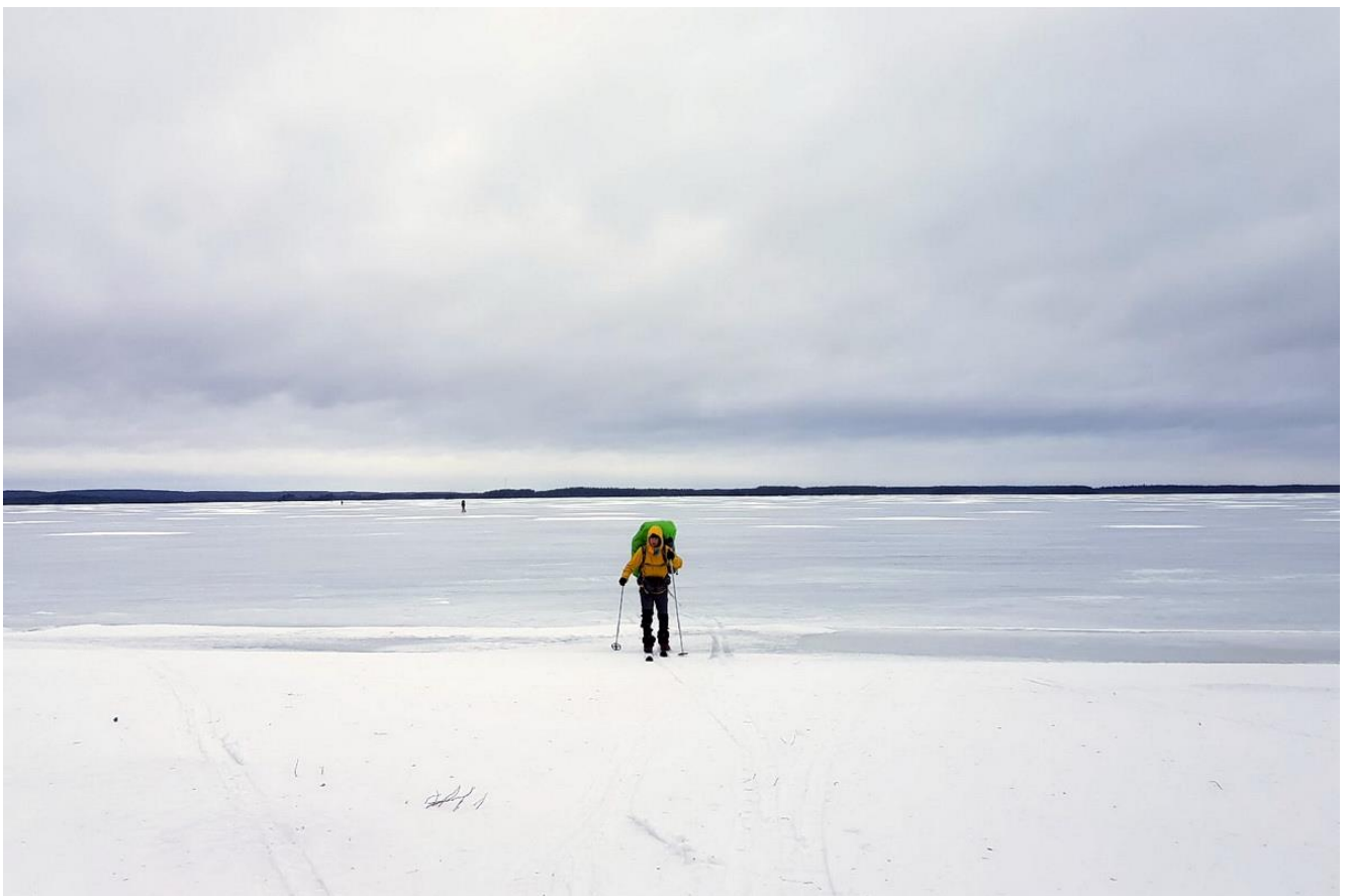
Фото 2. Голый лед на Беломоро-Балтийском канале.