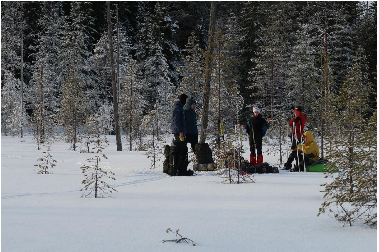
Фото 6. На болотах восточнее оз.Воеполь.