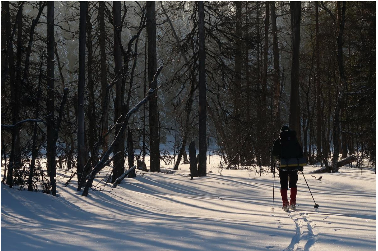
Фото 22. На переходе к озеру Худое Метчозеро.