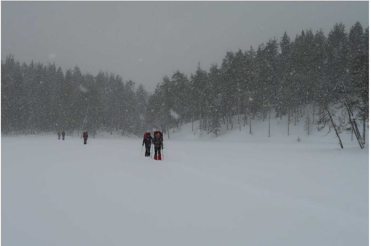
Фото 27. Метель на озере Варбоозеро.