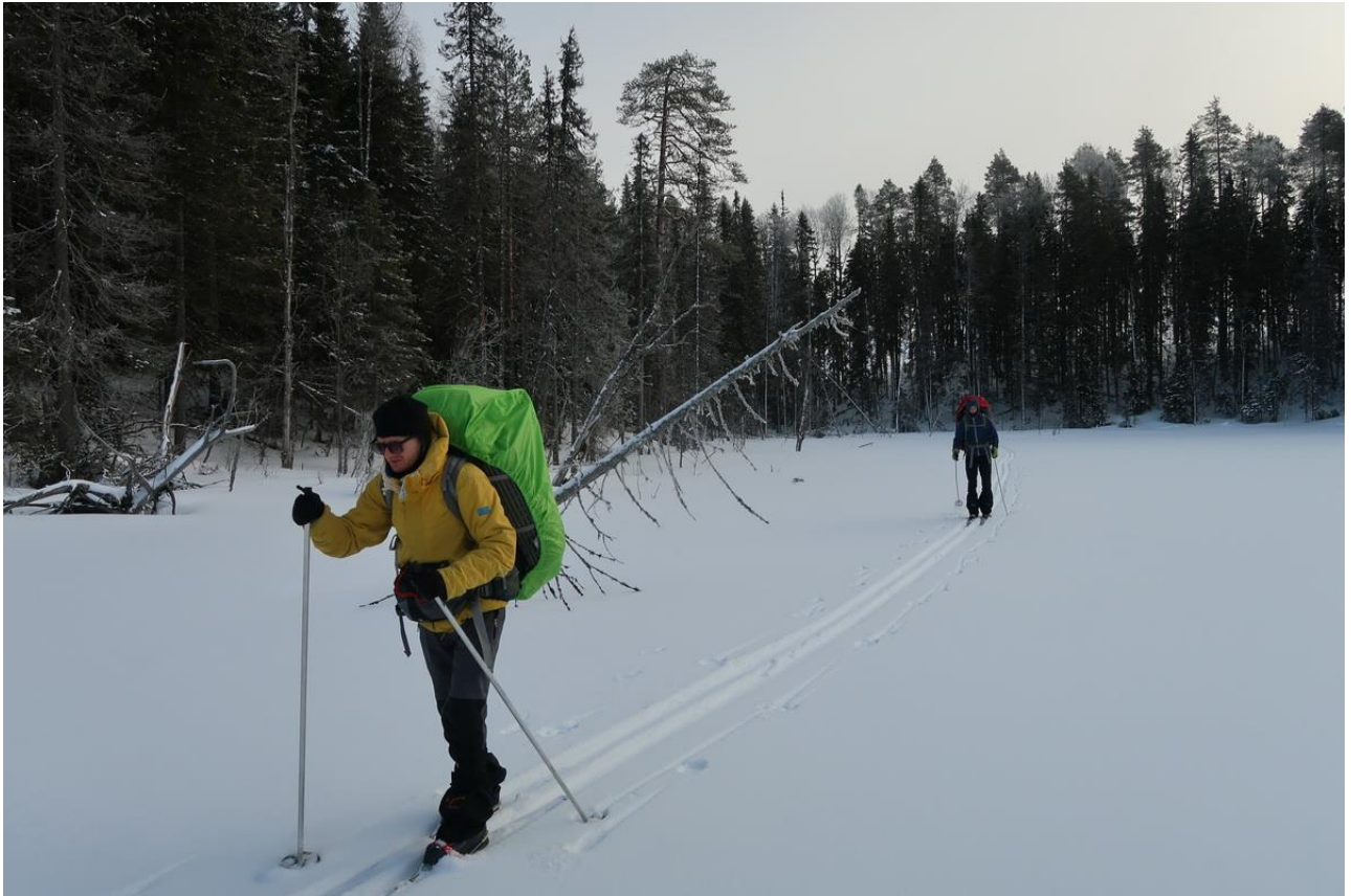
Фото 25. На озере Бадвино.