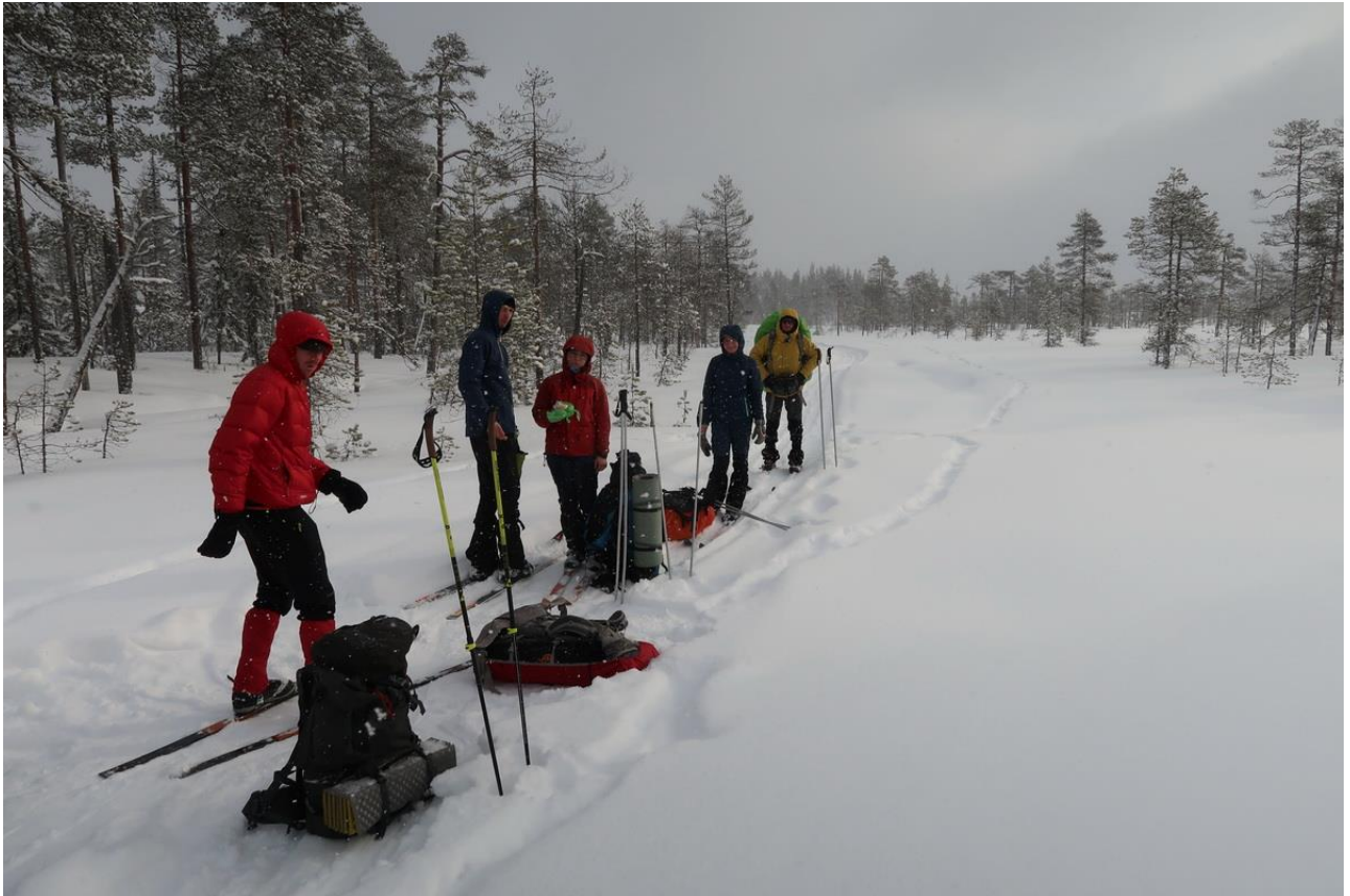
Фото 31. В районе Шовалевых Ламбин вышли на след снегохода.