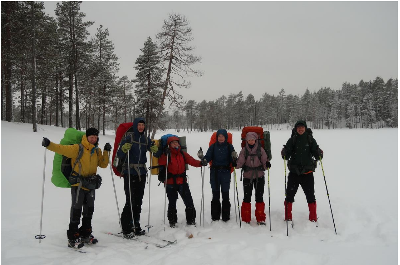
Фото 28. Группа на озере Красная Ламбина.