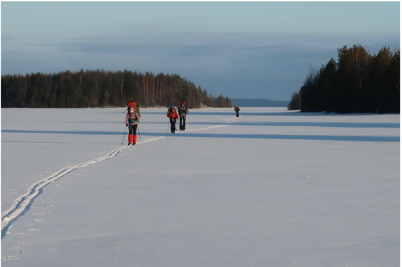
Фото 10. Движение по Сумозеру.