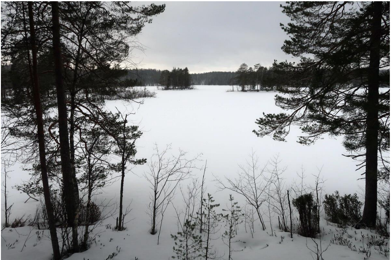
Фото 14. Озеро Нижнее Тумештозеро.