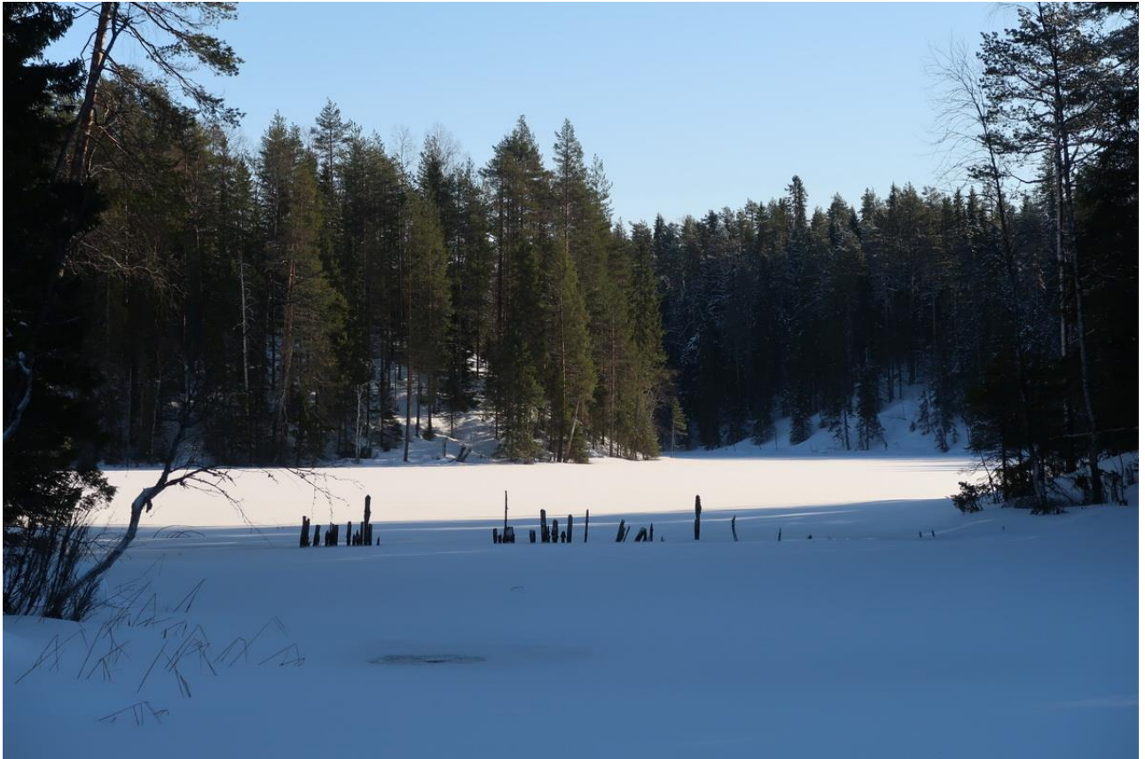
Фото 19. Остатки плотины между плесами озера Курганец.