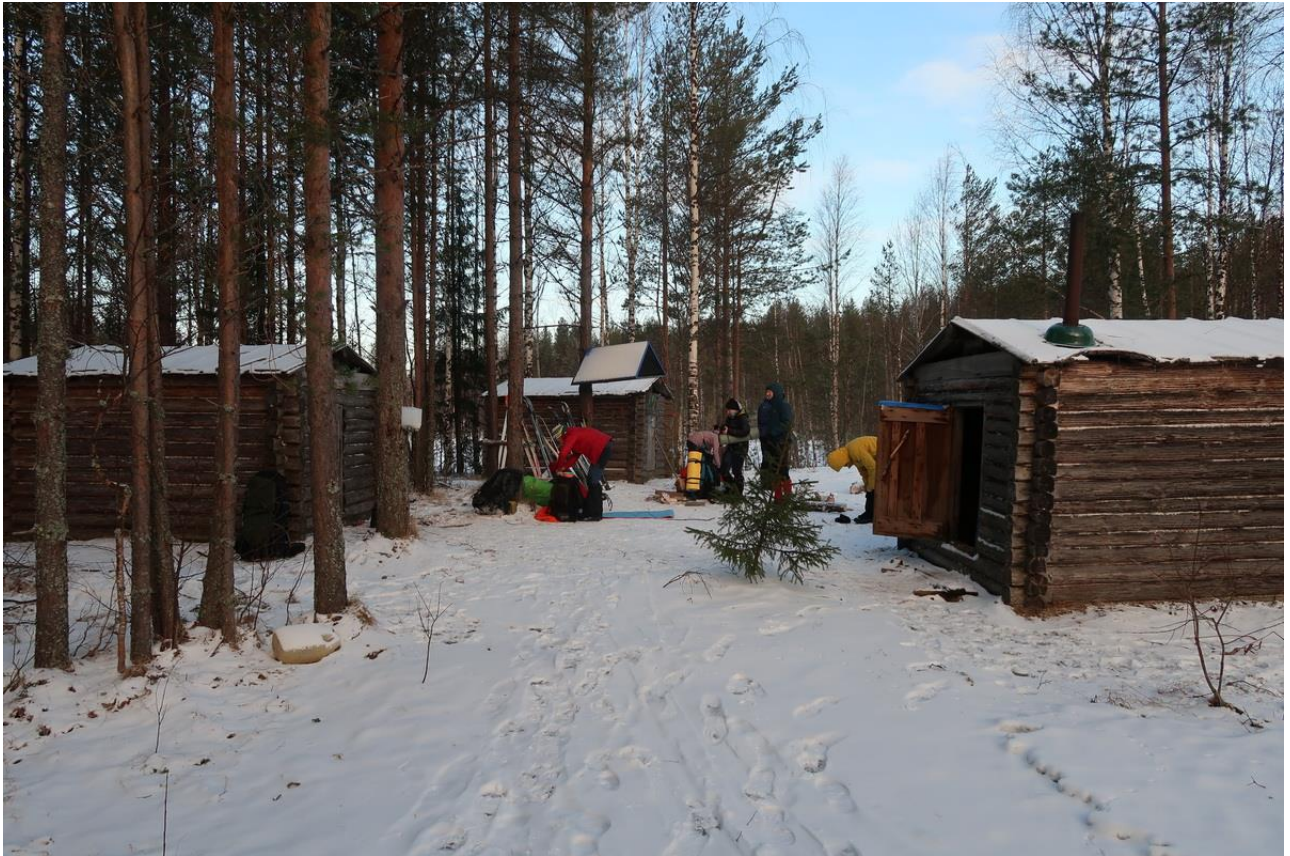
Фото 9. Избы на берегу Сумозера, 4-я ночевка на маршруте.