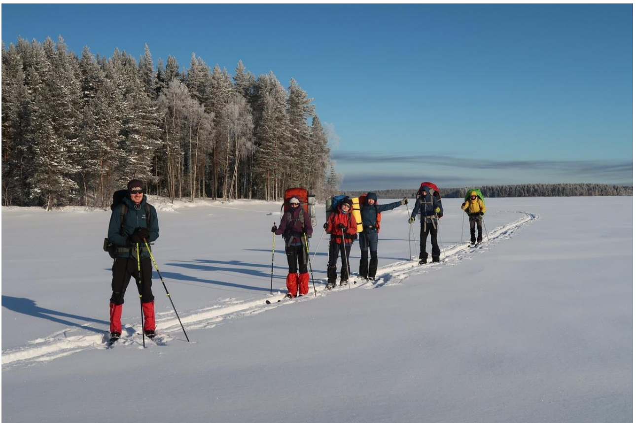
Фото 38. Движение по Выгозеру к финишу маршрута.