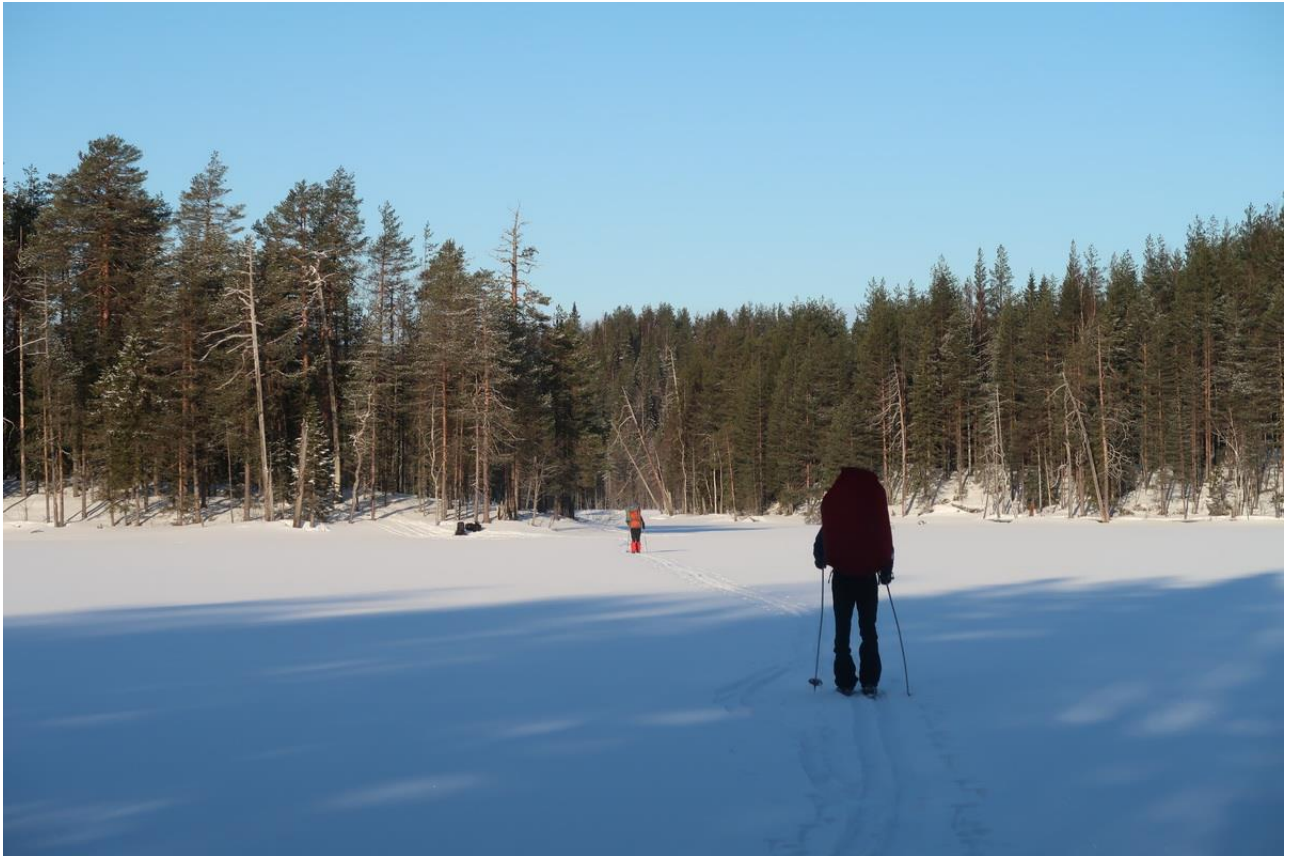
Фото 17. На озере Маткоозеро.