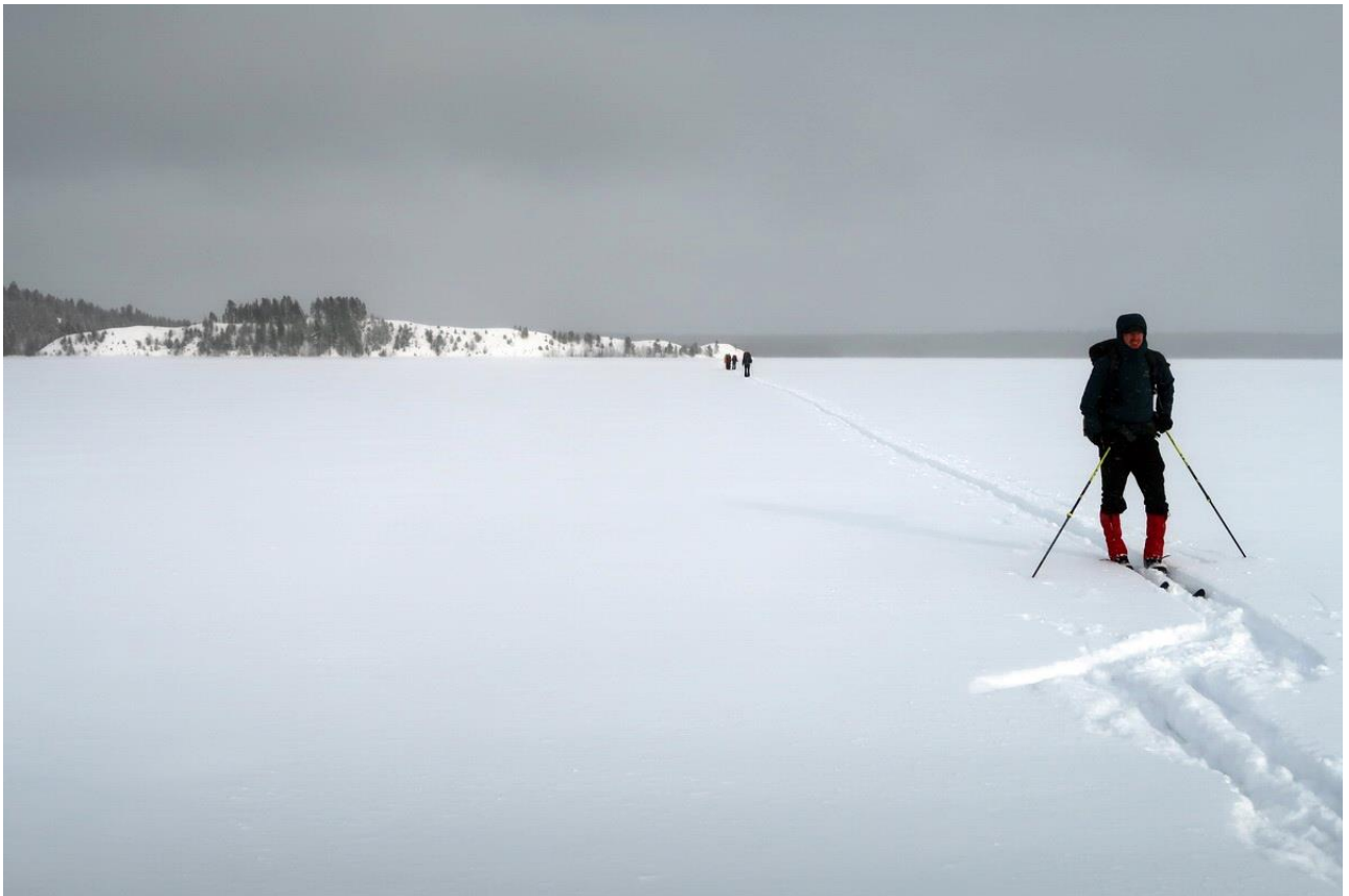
Фото 34. Движение по Выгозеру.