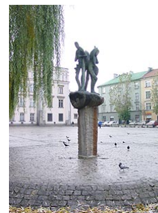
Фонтан «Три музыканта»

В составе огромного алтаря, созданного в 1634-1637 годах находится картина "Поклонение волхвов" Томасо Долабелла, придворного художника короля Зигмунта III (Zygmunt III).