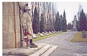
Памятник Советским воинам

Вскоре по правой стороне улицы, лежащей меж двух заборов, вы увидите вход на кладбище (надписи на вывеске сделаны, в том числе, на русском языке).