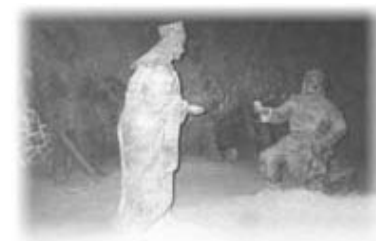
Памятник королеве Ядвиге

К сожалению от воздействия влажного воздуха соляные скульптуры и алтарь почти разрушились, поэтому чтобы их увидеть нужно применить фантазию.