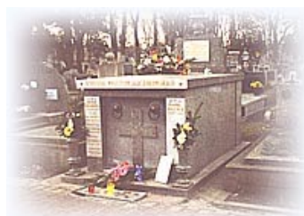
Склеп семьи Качаровских

Вы вышли снова на улицу Lubicz [Любич]. Прямо перед вами - современное офисное здание, а чуть левее - другое офисное здание, но уже из эпохи социалистической Польши. Тот, кто приезжает в Краков по делам, вероятно, хоть раз был там. Все комнаты в здании сдаются под офисы; здесь находятся офисы многих небольших фирмочек.