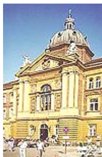
Здание Экономической академии