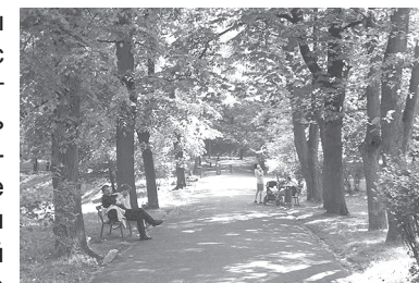
В парке Беднарского

Полюбовавшись на панораму города, мы двигаемся дальше по живописной улочке с частными домами, на которые тоже стоит посмотреть - ведь и они составляют часть Кракова. Через некоторое время улица уходит направо и начинает спускаться вниз (не спутайте её с пешеходной дорожкой - вы должны идти вдоль проезжей части). По этой улице можно выйти к костёлу Св. Юзефа на бывшей рыночной площади Подгуже.