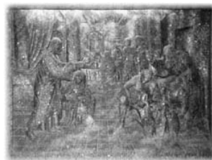
Барельеф в часовне Св. Кинги

В других залах вы увидите экспозицию посвященную национальным праздникам. Здесь показаны и костюмы ряженных, при чем очень своеобразные, и фотографии с реальными празднований. Выставлены также пасхальные яйца с типичными для различных частей Польши раскрасками.