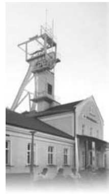
Шахтный ствол Даниловича

После катастрофической протечки воды в выработки шахты в 1992 году коренным образом меняются взгляды на деятельность шахты. Промышленная выработка соли закрывается и Величка начинает функционировать только как туристический объект.