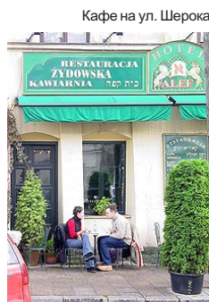
Кафе на ул. Шерока

Внутри находится также небольшой книжный магазин. Литература в основном на английском и немецком язы-