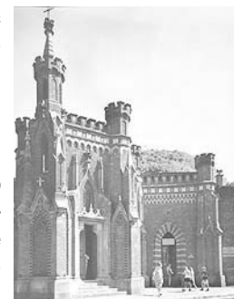
Часовня Св. Брониславы - вход на курган Костюшки

Самый доступный для посещения курган - курган Костюшки. Автобус 100 маршрута подъезжает прямо к его подножью. С одной стороны автобусной остановки находится лестница, ведущая на площадку кафе RMF, а с другой - часовенка, служащая входными воротами на курган.