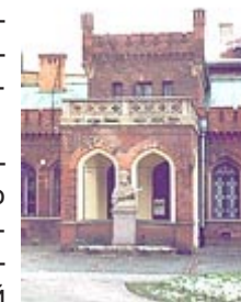
Здание Стрелецкого братства

Любителям пива будет небезынтересно узнать, что здание находящееся на другой стороне улицы Lubicz - это пивоваренный завод "Okocim" [Окочим]. Популярная ранее в Польше марка пива, сегодня постепенно вытесняется с рынка. Дело в том, что завод был куплен фирмой Carlsberg, которая продвигает на рынок собственную торговую марку. Так что попробовать старый добрый Окочим можно только в Малопольше (так называется воеводство, столицей которого является Краков).