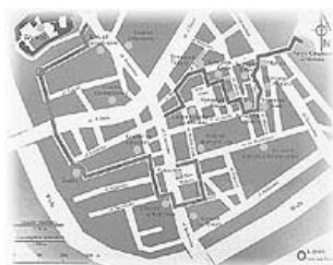
Указатель на краковской улице

Но после долгих безуспешных попыток его восстановления было решено насыпать курган заново. Для этого его сначала срезали, а потом стали воз-