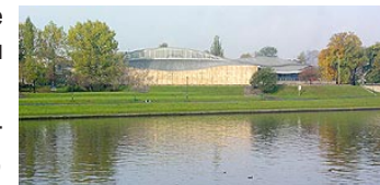
Дом японской культуры

А напротив него - новая достопримечательность Каркова - памятник собачей верности (там, где кончается улица Smocza).