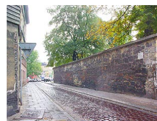
Выход на улицу Мёдова

Следующая часть экскурсии будет интересна только любителям Еврейской культуры. Мы посетим Новое кладбище, увидим дом где жил еврейский поэт-бард Мордехай Гебиртиг. Это значительный крюк в сторону. А потому, что бы не утомлять остальных, я предлагаю разделиться.