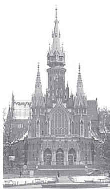
Костёл Св. Юзефа

Следующая остановка - часовня Св. Креста (Kaplica Sł. Krzyża), установленная в выработке XIX века.