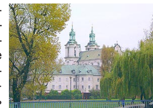
Костёл Паулинов на Скалке