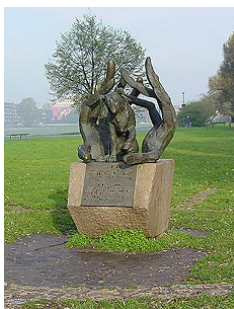
Памятник собачей верности

От памятника мы спускаемся к Висле (подальше от опасного перехода), проходим мимо кафе-пристани (Впрочем, почему мимо? Мы можем задержаться здесь.), под Грюнвальдским (Grunwaldski) мостом, затем снова поднимаемся на пригорок и выходим к костелу св. Михаила и Станислава на Скалке (Sw. Michala i Stanisława na Skalce), что принадлежит находящемуся рядом монастырю Паулинов.