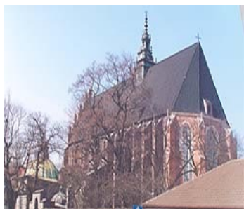
Костёл Тела Господнего

Вот только увидеть здание костела полностью во всем своем великолепии практически невозможно из-за плотной городской застройки.