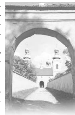
Вход в костёл Камедулов

В остальные дни сюда могут попасть только мужчины, и то лишь в определенные часы. Расписание таково: с 8:00 до 11:00 и с 15:00 до 16:30 желающих пускают каждые пол часа.