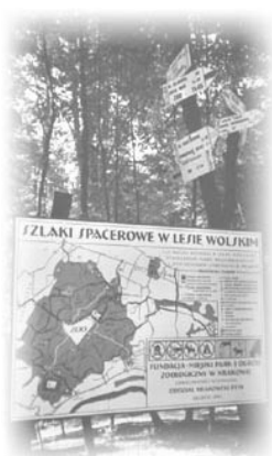
Указатели туристических трасс в Вольском лесу

Легенда гласит, что когда семь веков назад татарские орды подошли к Кракову, монашки-нонне, что бы сохранить жизнь и честь решили