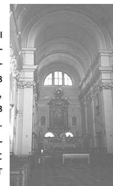
В костёле Камедулов