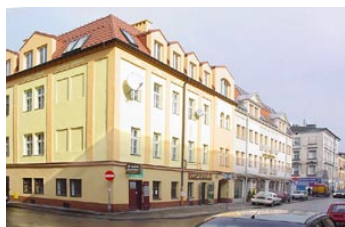
На улицах Казимежа

Многие евреи, уехавшие по разным причинам из Польши, по сей день являются официальными владельцами домов в Казимеже, и их дети по наследству получают право на недвижимость, даже сами не зная об этом. Поэтому некоторые адвокатские конторы неплохо на этом зарабатывают. Они отыскивают в архивах имена бывших владельцев, и затем разыскивают в Израиле (или других государствах) их детей. Затем у наследников покупается их собственность (ну кому из наследников охота влезать в бизнес в незнакомой стране, когда у каждого своя жизнь и карьера). Затем адвокатские конторы просто перепродают эту недвижимость новым владельцам в Кракове.