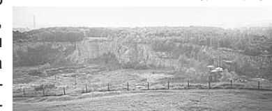
Вид на каменоломню с кургана Кракуса

Спустившись, мы пойдём от кургана по дорожке вниз, и минув улицу Pod Korsem, пройдем никуда не сворачивая до улицы Lanckoronska, и обойдем стоящие дома справа. Выйдя к трамвайным путям, и пройдя налево через туннель, попадаем на пе-