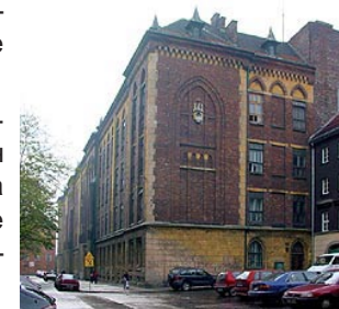
Здание школы на улице Узкая

В течение XIX века еврейское население постепенно занимает весь Казимеж и соседний район Страдом (Stradom). Во второй половине XIX века евреи принимали активное участие в обустройстве района в качестве инвесторов, руководителей строительства и архитекторов.