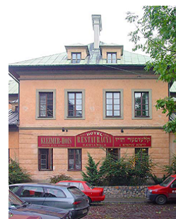
Ресторан «Клейзмер Хойс»

И если несколько лет назад ночной Казимеж ассоциировался, скорее, с опасностью быть ограбленным, то сегодня количество маленьких кафе и ресторанчиков увеличивается с каждым месяцем. И летними вечерами практически на каждой улочке, в каждом переулке то здесь то там слышится музыка, доносящаяся из открытых окон кафе.