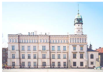
Бывшее здание Ратуши. Ныне - этнографический музей

Старые копии стали известны по всей Европе. До такой степени, что английский учебник географии конца XIX века после подробного описания Велички помещал маленькую приписку, что недалеко от Велички находится Краков - древний город коронации польских королей.