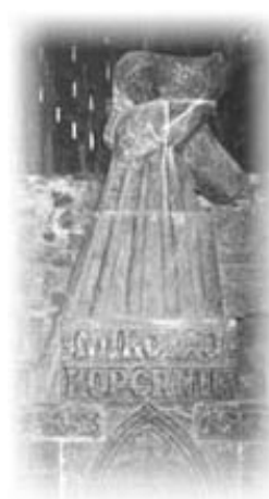
Памятник Николаю Копернику

"Исторические Соляные копи в Величке - это единственный в мире горнопромышленный объект, работающий без перерыва от средневековья до наших дней. Оригинальные выработки (штреки, спуски, эксплуатационные камеры, озёра, шахты, шурфы) общей длиной около 300 километров, расположенные на 9 уровнях, пролегающих до глубины 327 метров, показывают все этапы развития горной техники в отдельных исторических эпохах." Так звучит фрагмент обоснования записи Соляной шахты "Величка", произведенной 9 сентября 1978 года в I Список ЮНЕСКО из 12 объектов мирового культурного и природного наследия.