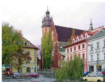
Костёл Тела Господнего в Казимеже

Сегодня это один из районов Кракова, но до 1800 года он был отдельным городом, окруженным Вислой. Были у горда и оборонительные стены, почти не сохранившиеся до наших дней, и своя ратуша, и т.д.